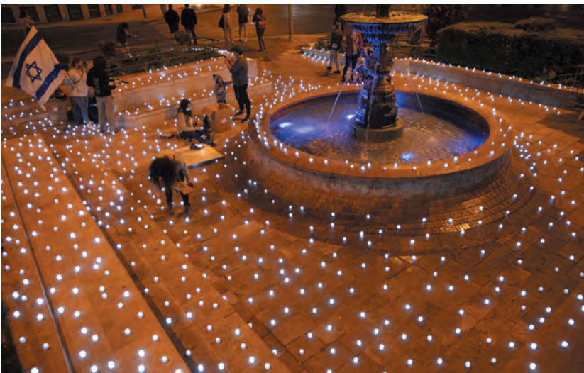
A koronavírus-járvány következtében elhunytak emlékére gyűjtanak meg LED-es mécseket Jeruzsálemben estéknént.