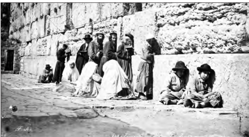
Zsidók imádkoznak a Siratófalnál 1870-ben

A Szentély nyugati falának pusztulása után maradt tehát a Templom-hegy nyugati támfala, ami viszont nem az egyetlen fal, amely fennmaradt az óvárosban. A déli és a keleti támfal ugyanis szintén áll még Heródes hatalmas építményéből. Csak az északi fal nem maradt meg teljes