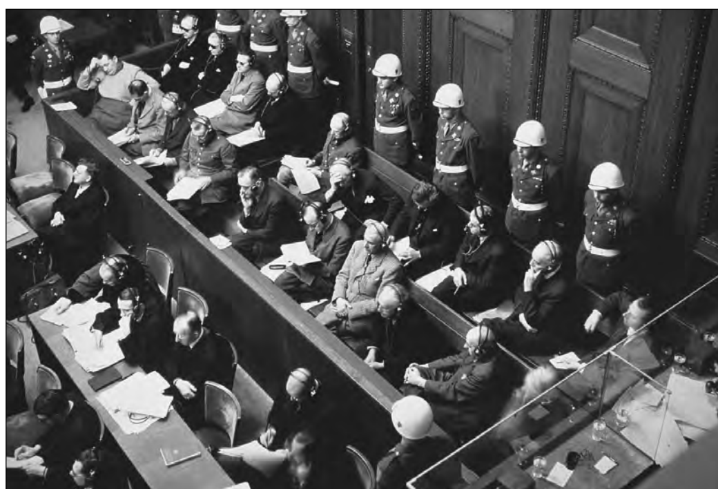
A vádlottak a tárgyalóteremben, amerikai katonai rendészek gyűrűjében

A bíróság állandó székhelye Berlinben volt, de a tárgyalások helyszínül Nürnberget választották – a döntésnek szimbolikus jelentősége volt, mert Hitler uralma idején itt rendezték a Nemzetiszocialista Német Munkáspárt pártnapjait, s itt született meg a zsidóság jogfosztását szentesítő törvények is. A per 1945. november 20-án kezdődött az Igazság-