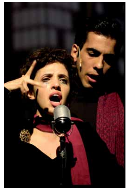
Beer Sheva-i Színház