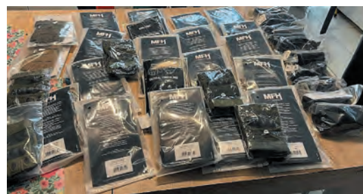
Az adományokból vásárolt taktikai kesztyűk, kiküldésre várva

Igazán felemelő visszajelzéseket kaptak, például videoüzeneteket és fényképeket arról a pillanatról, amikor célba értek a dolgok, a katonák pedig