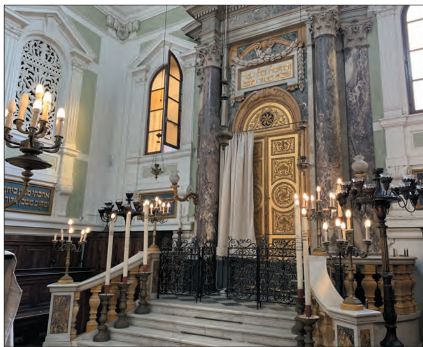
Olaszország. Veszélyben a sienai zsinagóga

Az antiszemita provokációk száma a 2023. október 7-i Hamász-támadás óta megsokszorozódott, és 1980 óta a legmagasabb szintre emelkedett. Az események monitorozása során 121 esetet rögzítettek, közülük 20 közvetlen fenyegetést jelentett zsidó személy vagy csoport ellen. Megfigyelők szerint az antiszemita akciók többségét senki sem tartja