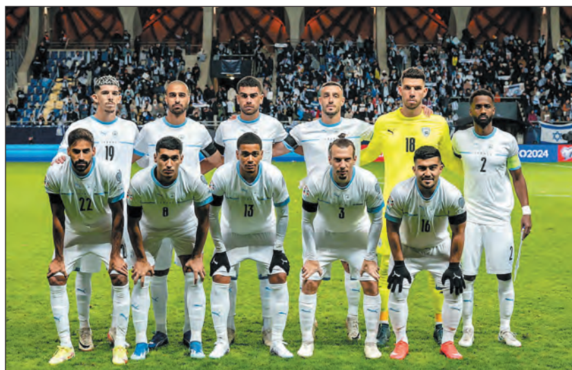
Az izraeli válogatott a felcsúti Pancho Arénában

Az izraeliek még reménykednek abban, hogy a fontos mérkőzésen odahaza, telt ház előtt játszhat a válogatott, de realistikus is egyben, ezért