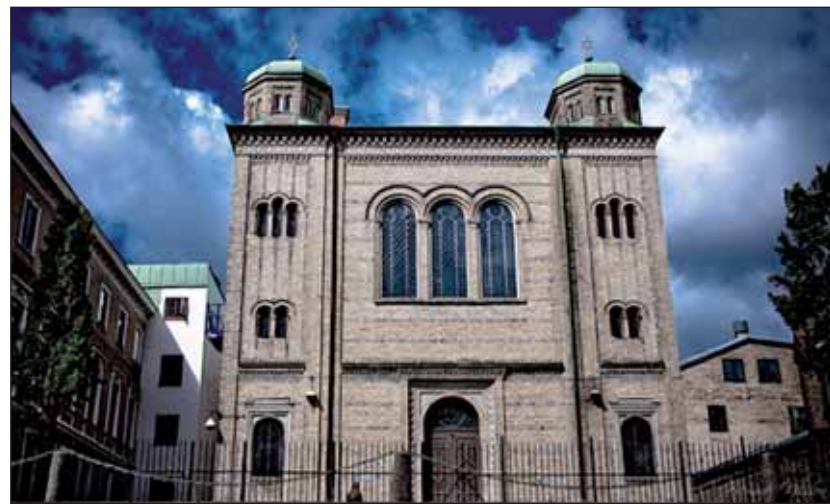
A göteborgi zsinagóga