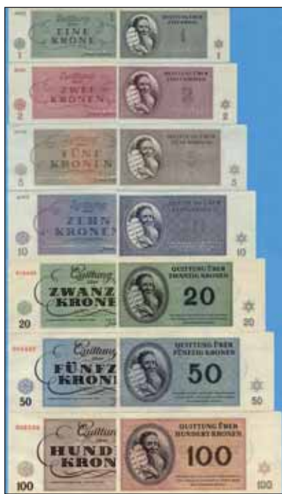
Külön pénzt nyomtattak...

Most, hatvanöt évvel később, Terezin ismét a nemzetközi és a magyar érdeklődés középpontjába került. 1945. április közepén ugyanis több ezer, eredetileg szegedi, debreceni, budapesti gettólakót, zsidó deportáltat hurcoltak Ausztriából és a bergensbelseni halállágerből a csehországi zsúfolt börtönvárosba. Ez a háború legutolsó felvonása volt, hiszen már Auschwitzot is elfoglalták a szovjet csapatok. Tehát a haláraitélteteket csak kisipari eszközökkel: kézfegyverrel, tüfusszal, éhséggel ölhettk meg.