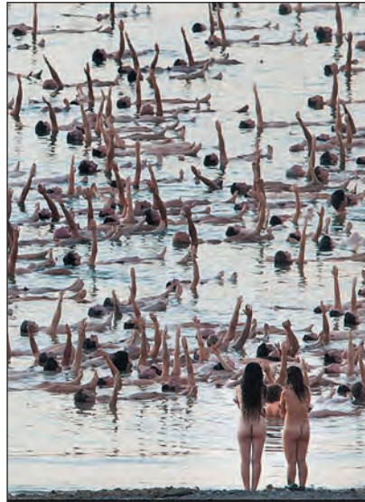
Meztelen emberek fürdenek a Holt-tengerben Spencer Tunick művészeti projektjében

Az izraeli strandon ruha nélkül lehet fürdeni a meleg, sós vízben, majd a látogatók testüket nyugtató ásványi anyagokkal feltöltött fekete iszappal kenhetik be. Ehhez a cikk szerint nem kell mást tenni, mint a Holt-tenger nyugati partja felé venni az irányt. Nagy valószínűséggel ez az egyetlen olyan hely a Közel-Keleten, ahol a nyilvános meztelenedés