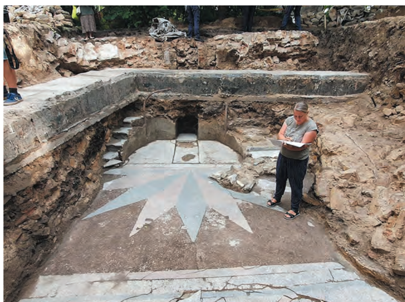
Litvánia. Az 1630-as években épült nagyzsinaogó feltárása