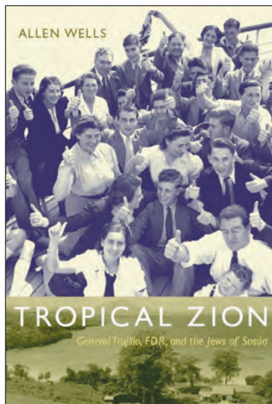
Dominikai Köztársaság. A trópusi Cion