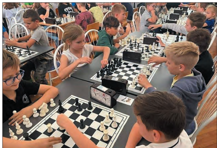
A jövő nagymesterei Nyíregyházán

Nagyon szépen köszönünk minden segítséget.