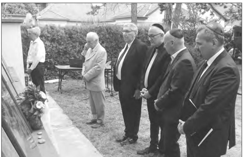
Helyi vezetők főhajtatása Szentesen

(Forrás: Önkormányzati Hírek, 2023. július 4., szöveg és fotó: Ádám Miklós)