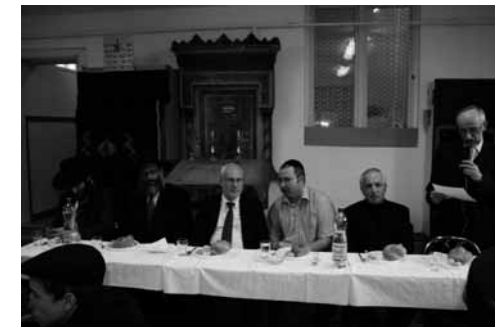
A fehér asztalnál...