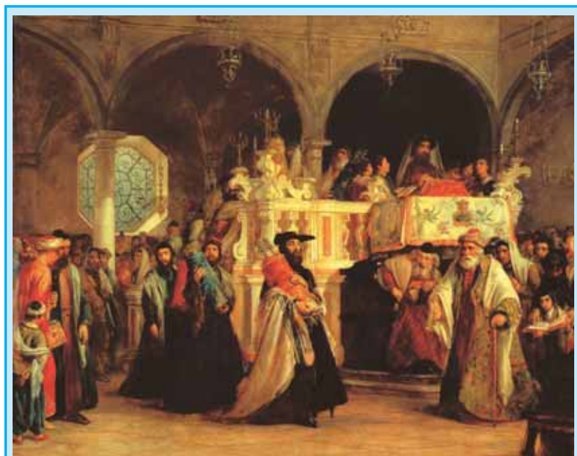
Solomon Hart (1806–1881): Zsinagógaavatás