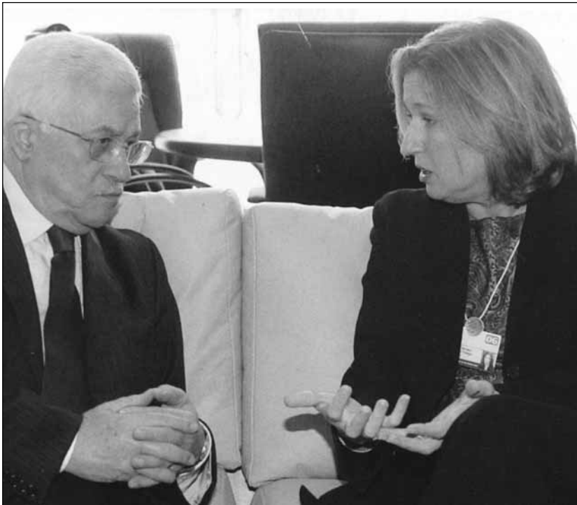
Mahmud Abbas és Cipi Livni. Mi lesz Jeruzsálemmel?

Miután Ehud Olmert miniszterelnök kénytelen volt lemondani hivataláról az ellene felhozott korrupciós vádak miatt, tisztújító választást írtak ki az általa vezetett Kadima kormánypártban. A volt miniszterelnök a tények ellenére tagadja a vádakot. Kijelentette, hogy bár több hibát követett el és lemond, de a későbbiekben bebizonyítja, hogy a gyanúsítások alaptalanok voltak vele szemben.