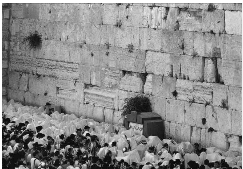
Csoportos duchán a Siratófalnál