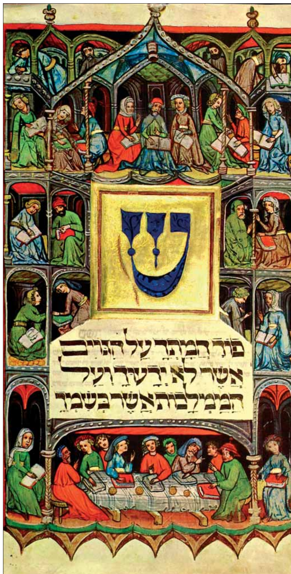
Kézírtos haggada-részlet a 15. századból