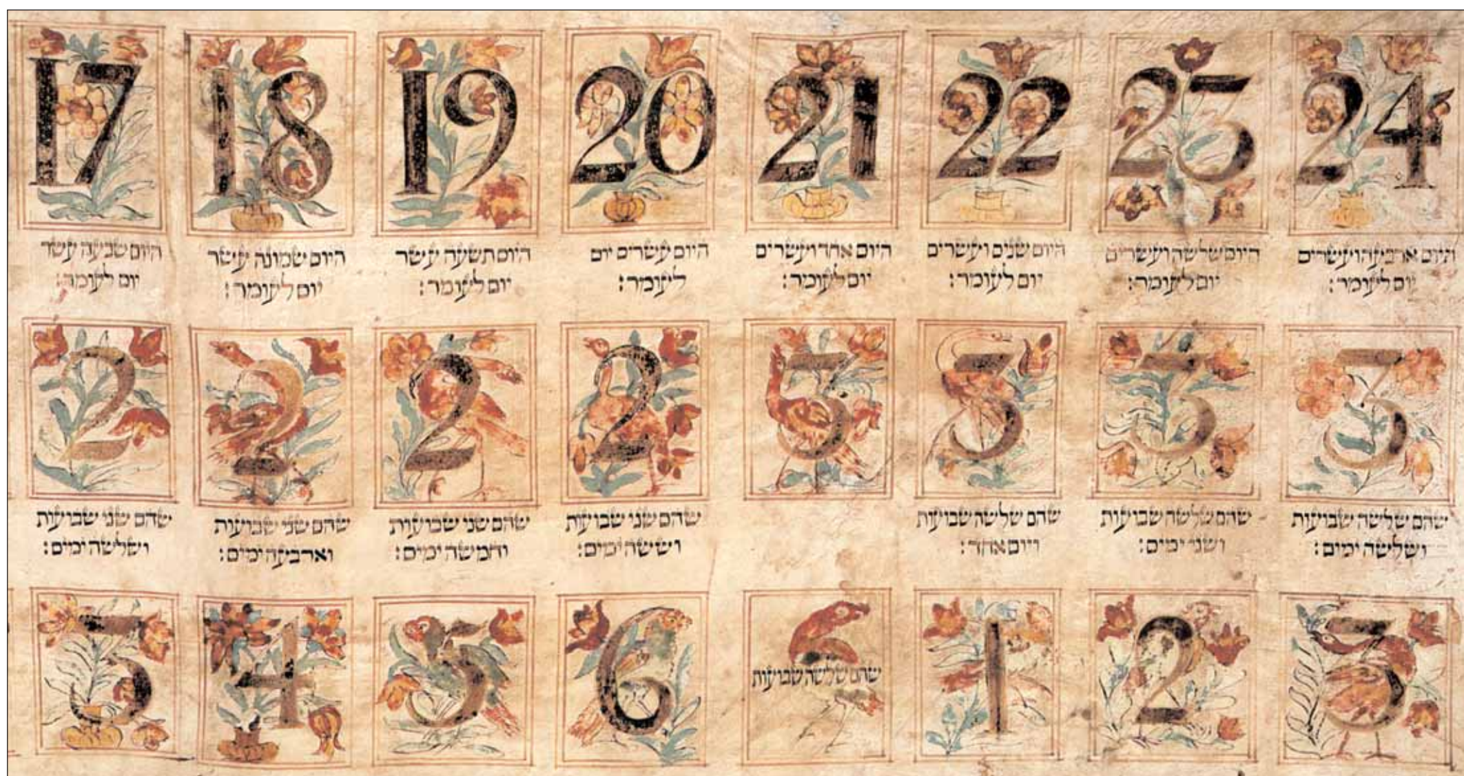
Omer-naptár (Hollandia, 18. sz.)

A háromórányi esemény közös Ádon olámmal fejeződött be, majd nagyszabású vendéglátással, bőséges és válogatott finomságok közös elfogyasztásával zárult a program.