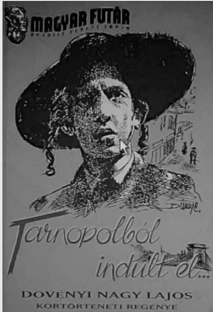
A reprint kiadás 2007-ben jelent meg Budapesten...

önök ennek-a számnak csak kis százalékát hitték el, mondjuk csak tíz százalékát, akkor is másfél millió védtelen és fegyvertelen és ártatlan ember lemészárlásáról tudtak!