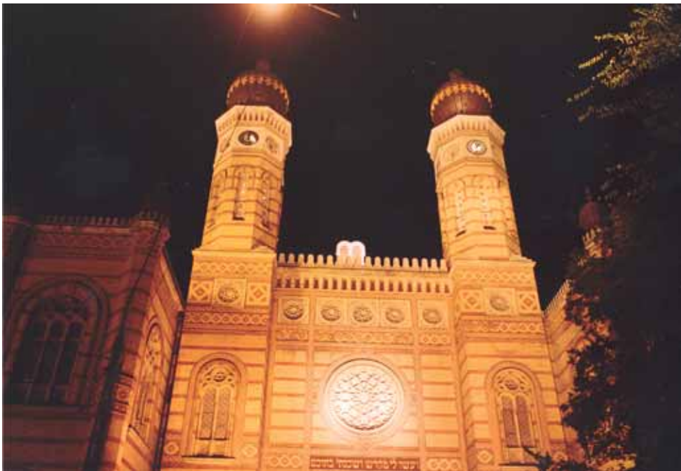
150 éves a neológia fellegvára