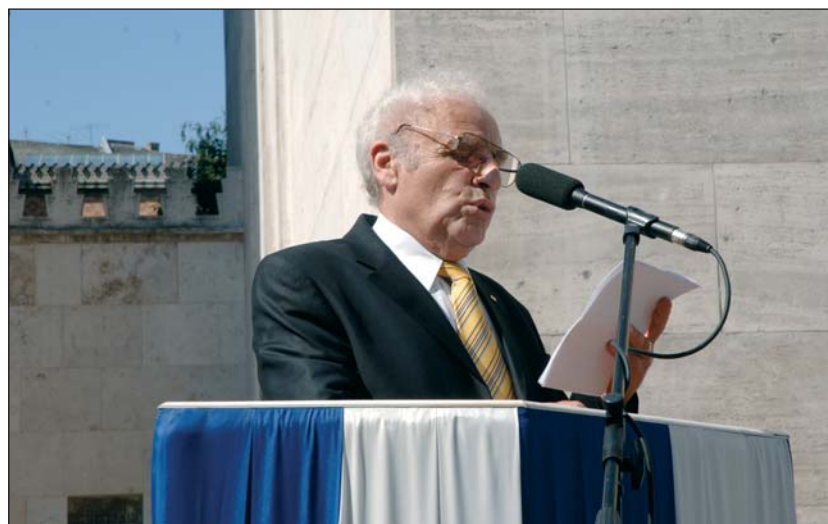
Zoltai: Újult erőre kapott a gyűlölködők hada

Ettől nem könnyebb, hanem még sokkal nehezebb lesz a mai gazdasági, társadalmi helyzet. Felélesztik a gyűlöletet, bűnbakot keresnek, és a