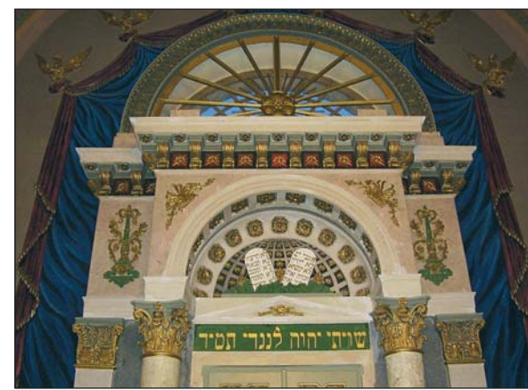
A zsinagóga belülről

– Női szemmel hogyan látja vallásunkat, zsinagógáinkat, és bennük a hölgyek szerepét?