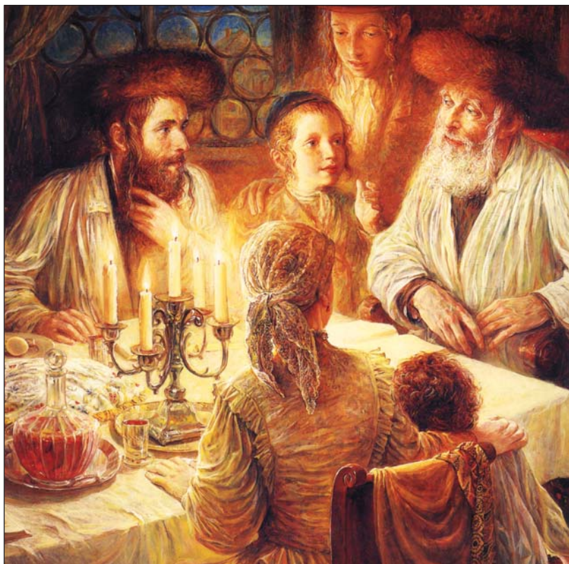
Család, otthon – valamikor

Szabadjon most egy kis kitérőt ten- ni. Azért vállaltam ezt az előadást, mert Debrecen mindig is szívügyem marad, de most az előzetes program- ban szerepelt, hogy az istentiszteletek a Pásti utcában lesznek. Bár a Kápol- nási utcai zsinagóga is fontos nekem (amikor odajártam a Fazekas Által-