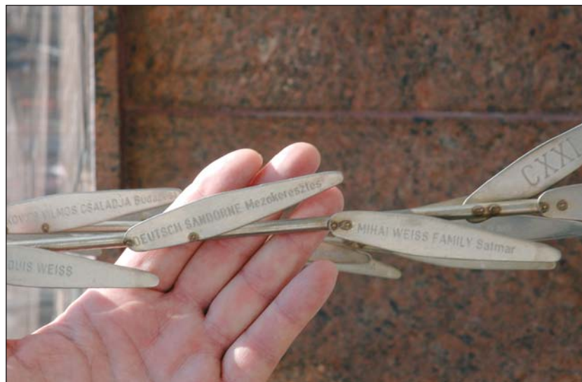
„Mindegyik levélkéjével ártatlan áldozatok neveit örökíti meg”

Történelmi írásokban olvasható, hogy ha a magyar hatóságok nem lettek volna annyira készségesek a zsidóság deportálásában, akkor az nem zajlott volna le olyan gyorsan, és akkor talán nem pusztult volna el annyi ember. Sajnos azonban a tények – tények maradnak. Hamillió európai és ezen belül hatszázezer magyar zsidó ember lett áldozata a fasiszmusnak, a második világháború borzalmainak.