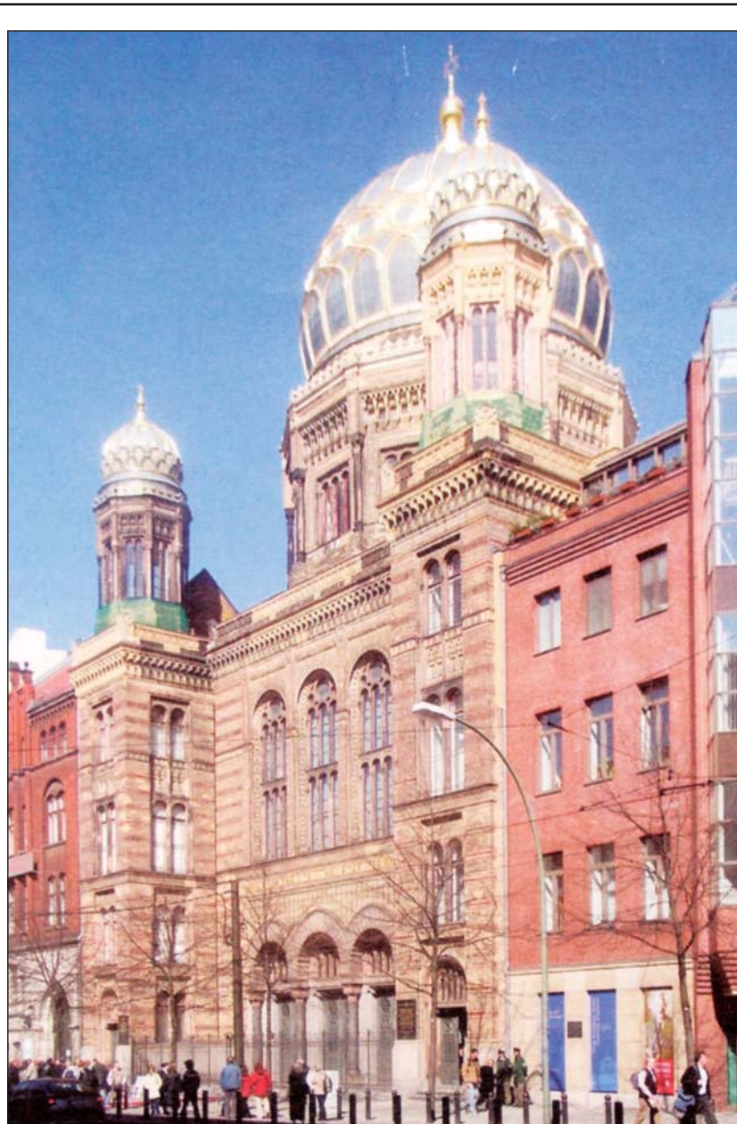
A berlini főzsinagóga

(Folytatás a www.mazsihisz.hu honlapon.)