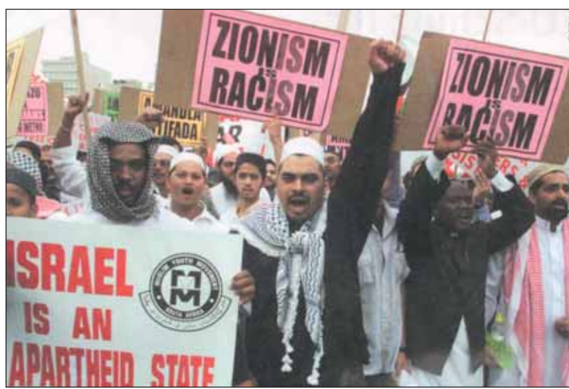
A jövődő államalapítók. Ők lesznek a tárgyalópartnerek

Fentiek tekintve e sorok íróját az sem nyugtatja meg, hogy Hussein Obama a következő választásnál a zsidó lobbira nemigen számíthat. Tudjuk, a vér nem válik vízzé: Obama – becsületére váljék – jó muzulmánként szépen idéz a Koránból. Ez bizonyára hízelgő az arab országok számára, de nekünk korántsem megnyugtató, hogy olyan kompromisszumokba akarja hazánkat belekényszeríteni, amelyek elfogadása esetén kiszolgáltatottá válnánk. Az amerikai elnök Izraelről nagy árat követel a palesztinokkal való bizonytalan kimenetelű