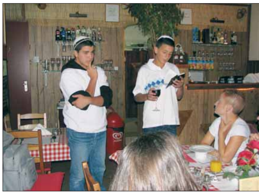
Jön a sábbát