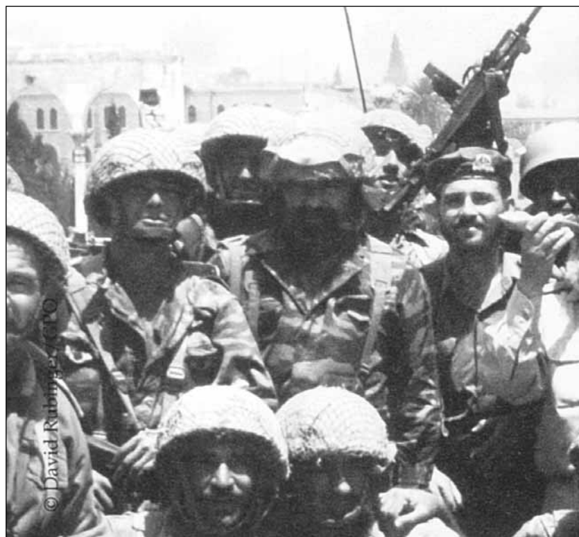
Hár hábját böjádi – A szentély hegye a kezében van

csak az a céljuk, hogy az egész zsidóságot a vádlottak padjára, pellengérré helyezték. Méltóztassék uraim megérteni! Mi nem védjük a bűnt, és nem védjük a bűnös zsidó egyént, de védjük, mihelyt a bűnös »zsidó« voltát hangoztatják. Védjük zsidóságunkat attól a látszattól, hogy egy »zsidó«, és nem pedig egy »ember« vétkezett.”