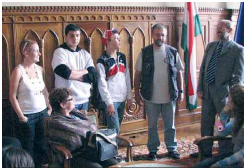
Látogatás a magyar Országgyűlés alelnökénél

A csoport bázisa a balatonlellel adventista üdülő volt. Magyarországi útjuk során a fürdés és a pihenés mellett a múlt megismerésére és a jellel való ismerkedésre is jutott idő. A tihanyi apátság, a székesfehérvári romkert, a veszprémi vár, a Hősök terének szoborgalériája vagy az Országház lenyűgöző épületének festményei és szobrai nemzeti történelmünk megannyi részletét, dicsőséges pillanatait és nehéz küzdelmeit tették ismertté a fiatalok számára. A budapesti városnézés során a Duna-parti „vascipők” meghökken-