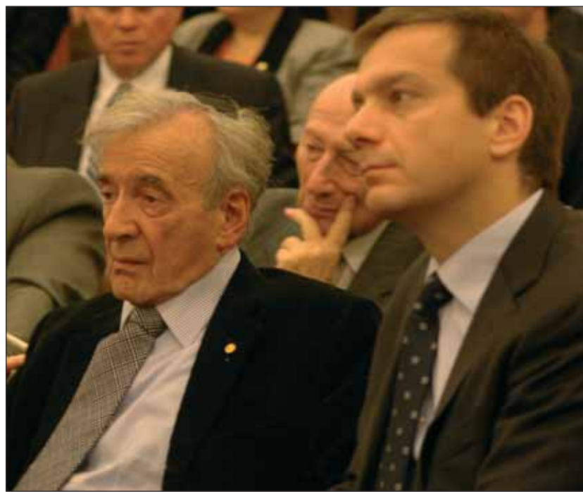
Elie Wiesel és Bajnai Gordon

Kányádi kezdeményezője volt az elhurcolás helyszínén felállított, az áldozatok nevét megőrző emléktáblának