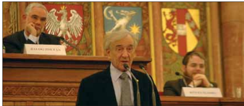
Annyira büszkék voltunk magyarságunkra, hogy naiv módon azt gondoltuk, megvéd bennünket

A MAGYARORSZÁGI ZSIDÓ HITKÖZSÉGEK SZÖVETSÉGÉNEK LAPJA