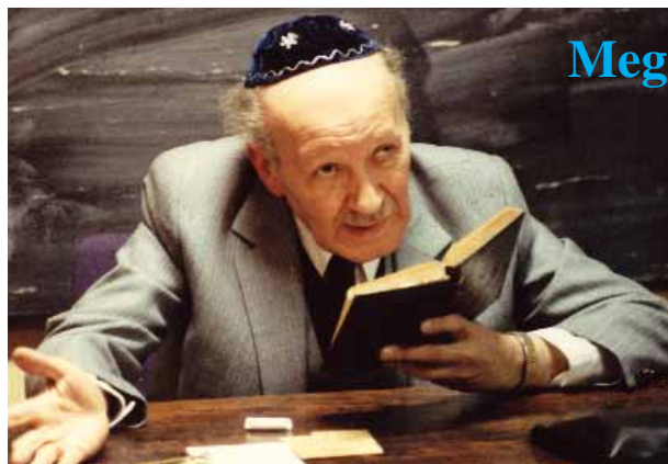
Megemlékezés a 25 éve elhunyt tudósról (3. oldalon)