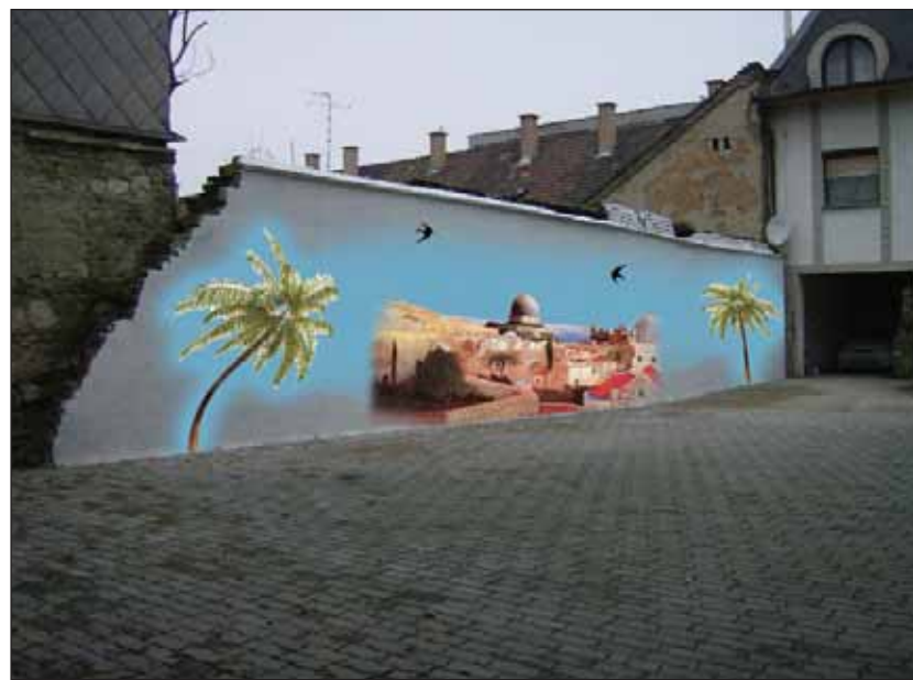
Az Újpesti Szeretotthon félmillió támogatást nyert el a Mazsük pályázata. Az összeget a működési költségekre, valamint az intézmény kertjében található tűzfal renoválására fordították.