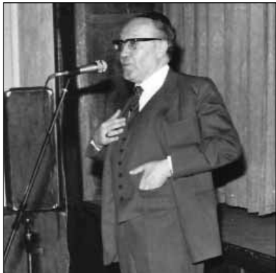
Előadás a Goldmark Teremben

Áv ho-ráchámon, jószágos atyja volt tanítványainak, s nemcsak ismereteik előrehaladására, de a lehetőség szerint anyagi gondok nélküli tanulásukra is kiterjedt figyelmével. Csodálatos módon mindig volt fedezete arra, hogy tanítványait, de szülőiköt is ismerőseink tag körét is anyagilag segítse, s létfenntartásukat megkönnyítse. Tanítványai számára szíve és otthonának ajtaja mindig