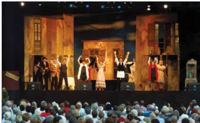
Részlet a Steti c. darabból

sabbakig dolgozó zsidókat utcára tették, és ha akartak, ha nem, útlevelet kaptak, elmentek. Csak az öregek, a betegek és a mozgásképtelenekek maradtak, akiket a Joint vett szárnyai alá.