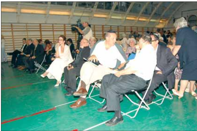
Egykor zsinagóga, ma tornaterem – a volt nagyzsínagóga