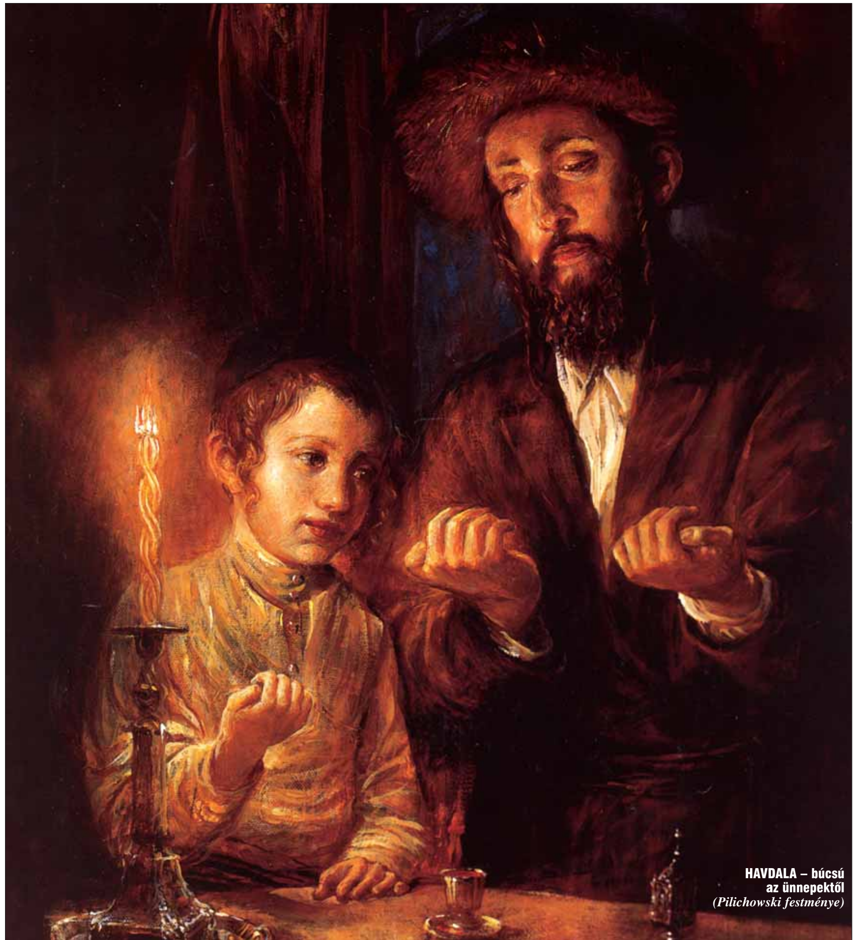
HAVDALA – búcsú az ünnepektől (Piłchowski festménye)