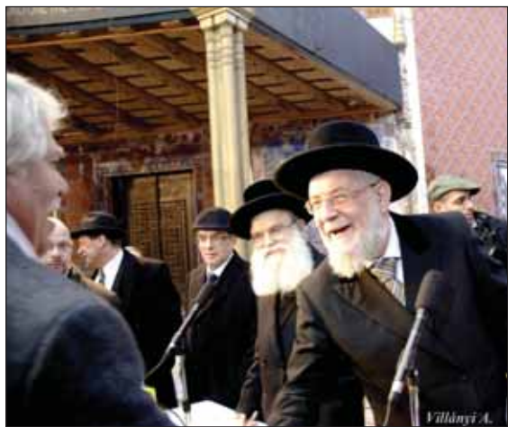
Érkezés a Rumbachba