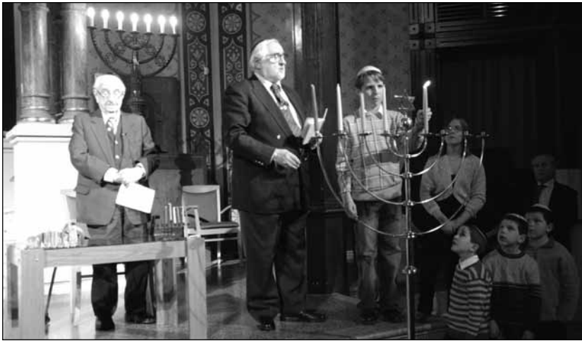
Egy szertartás a sok közül

gyöngyszeme. Visszakerült a kupolára a Dávid-csillag, és messziről, fényesen hirdeti az eredeti rendeltetést. A templomtérben helyet kaptak a szakrális tárgyak, így látni, hogy korábban ez nem hangversenyterem volt. A zsinagóga épülete már 42 éve a város tulajdona, jelenleg a Szechenyi Egyetem kezeli, melynek vezetőivel kiváló a kapcsolat, ennek hála a nagyobb eseményekre mindig „kölcsonkapjuk” a zsinagógát. És sír a szemünk, mert kevesen vagyunk. De lássuk, mi is történt tavaly.