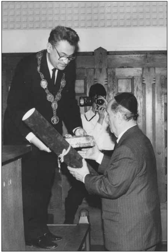
Egy kitüntetés a sok közül

Nem véletlenül idéztem fel Scheiber Sándor iktatóbeszédéből a zsidóságot jellemző szavakat: hazavágyódás és népszokások, vallás és népiség. Schweitzer József elkötelezetten hűséges a zsidó világ, s ezen belül különösen az ő- és máig-haza,