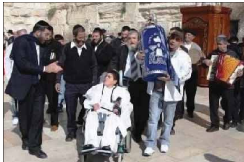
Bár micva a Siratófalnál, Jeruzsálemben