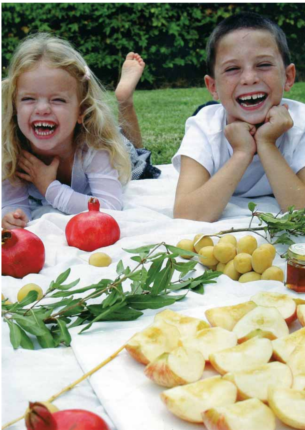
Ros hasáná Izraelben

„Soha ne félj! Ez a lényeg” – tanította rabbi Náchmán MiBrecláv.