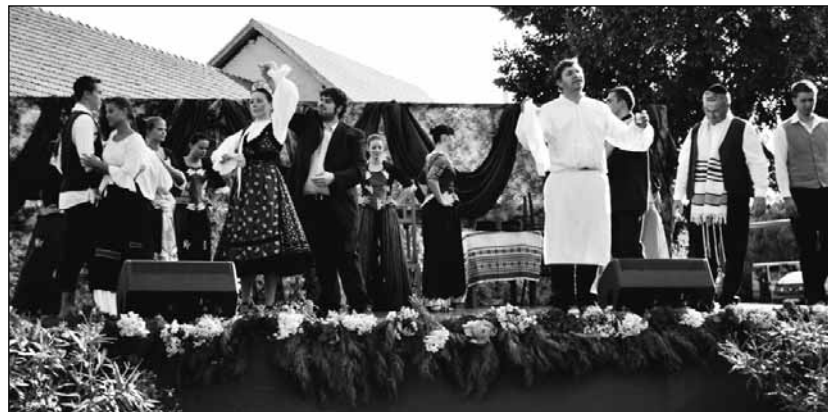
Kiskunhalas – tetőfokán a hangulat