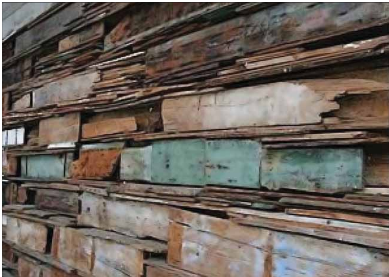
Az „Emlékezés Fala” Padovában

Békés, áldott, örömmel teli új esztendőt kívánok!