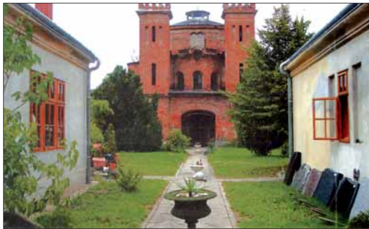
Az egykori zsinagóga. Enyészet előtt

Az elmúlt évtizedekben az 1944. nyári kőszegi deportálásról készült egykorú felvételeket számos kiadvány közölte. A kőszegi zsidó hitközség 1941-ben 109 főt számlált, a város lakosságának egy százalékát tette ki. Az 1944. nyári elhurcolást csak néhányan éltek túl. A hitközség 1951-ben megszűnt. A szomorú múltrol a patinás város központjában a zsinagóga pusztta téglafalai is tanúskodnak.