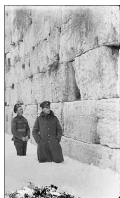
Britishkeit a Siratófalnál 1921