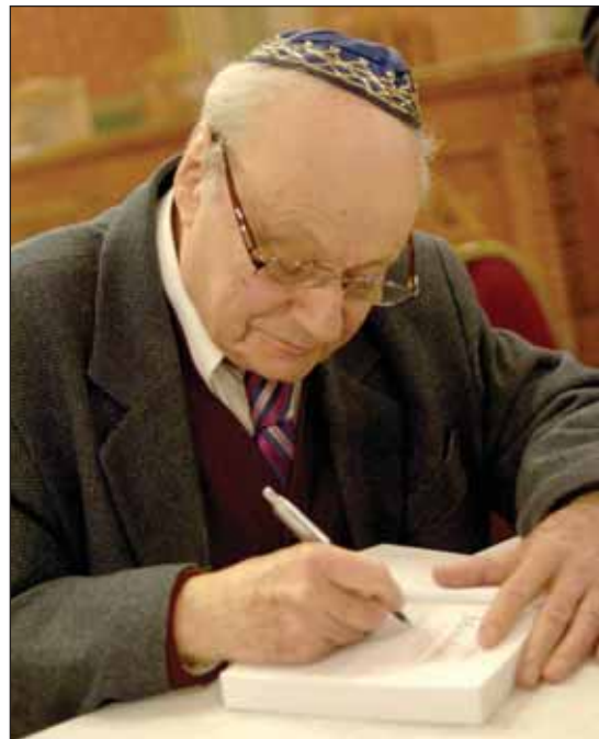
A szerző dedikál

előadását és a közreműködőknek a fáradozást. Annak örült a legjobban, hogy Voigt Vilmos bebizonyította: elolvasta a művet, sőt az előzőeket is ismerte. Mert már bizony volt olyan könyvbemutató, ahol a jeles és rangos személyiségnek fogalma sem