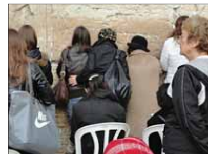
Jiddiskeit a Siratófalnál 2011