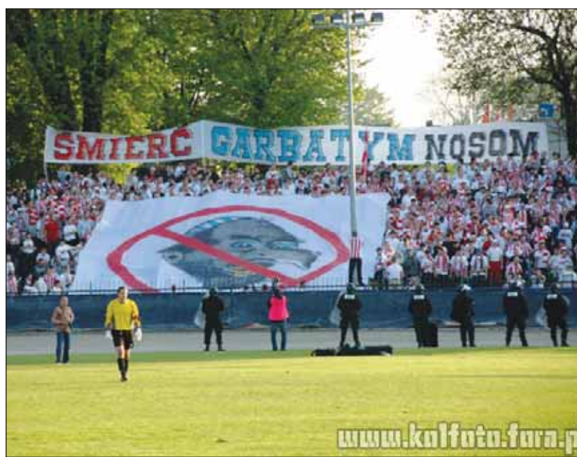
Halál a görbeorrúakra! Ehhez jön még a karikatúra, plusz húszezer néző. Ezúttal a lengyelországi Rzeszówban vagyunk, egy futballmeccsen. A nyomasztó lezárult, három ember felfüggesztett börtönbüntetést kapott.