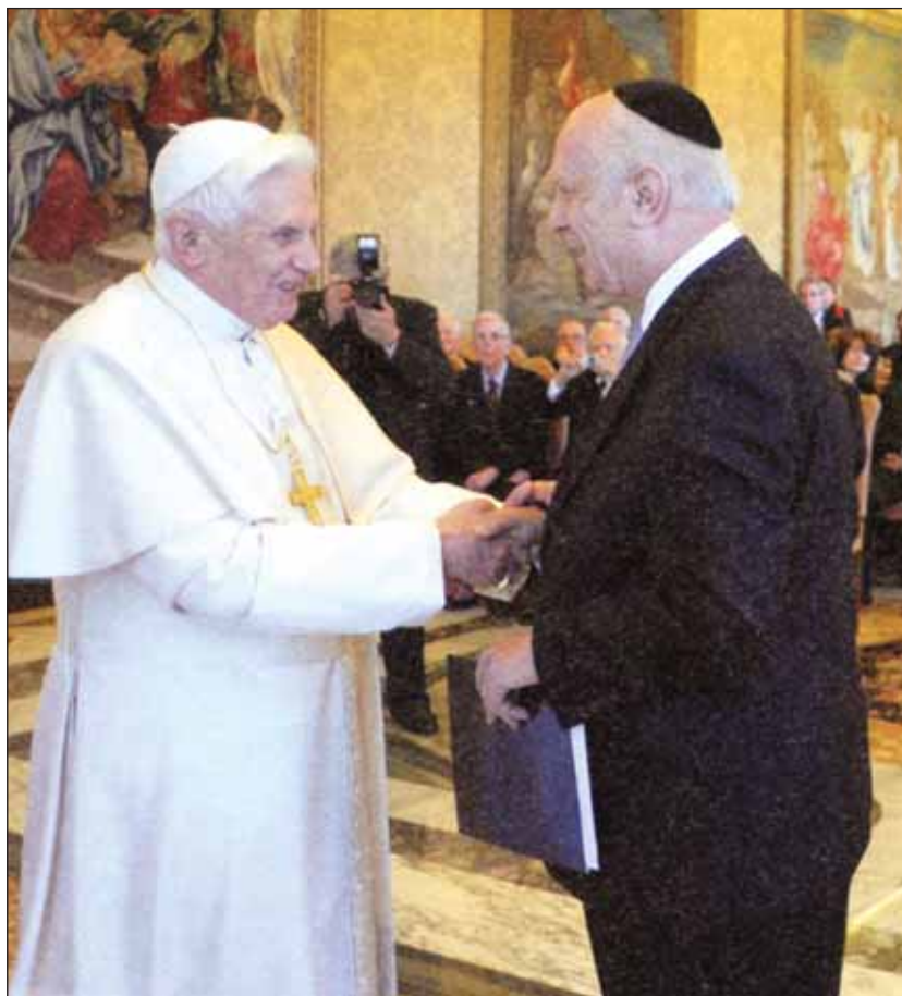
A képen Arthur Schneier New York-i főrabbi pápai audiencián

Ez egészen világos volt az egy évvel ezelőtti nagy-britanniai látogatás során, amely meglepően nagy érdeklődést keltett. Mindenki egy rendkívül udvarias és lelki embert látott a Szentatyában, egy valódi szentet. Ez