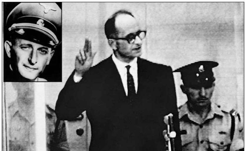
Eichmann bírái előtt