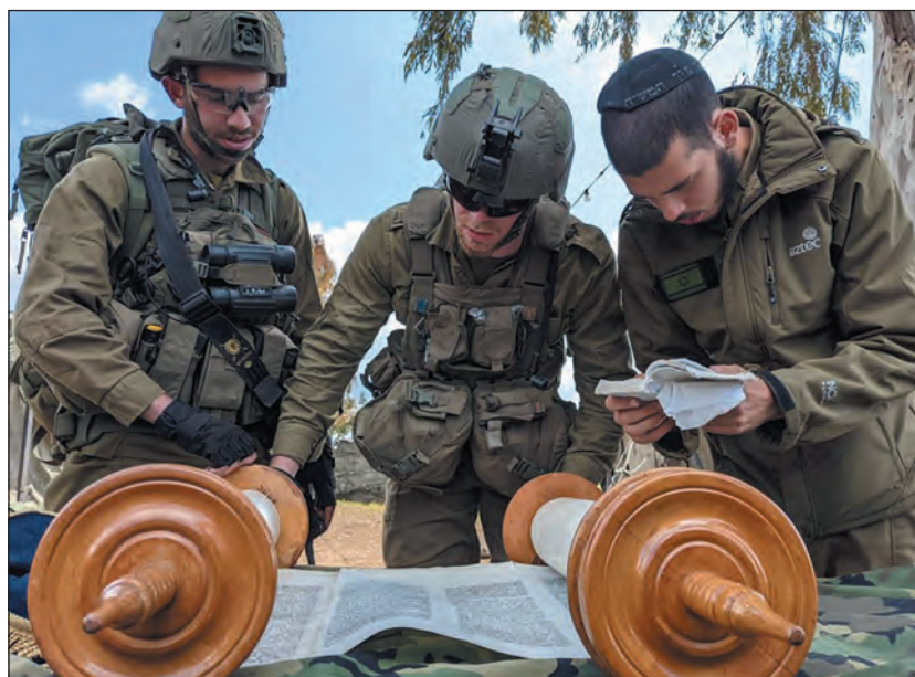
Az IDF katonái tóraolvasás közben

Szombaton eddig nem lehetett a rádiót és a telefonokat sem bekapcsolni, azonban a rendkívüli helyzetre való tekintettel ugyan csak alacsony hangerőn, de működhettek ezek az eszközök annak érdekében, hogy az emberek meghallják a biztonsági figyelmeztetéseket és utasításokat a polgári védelemért