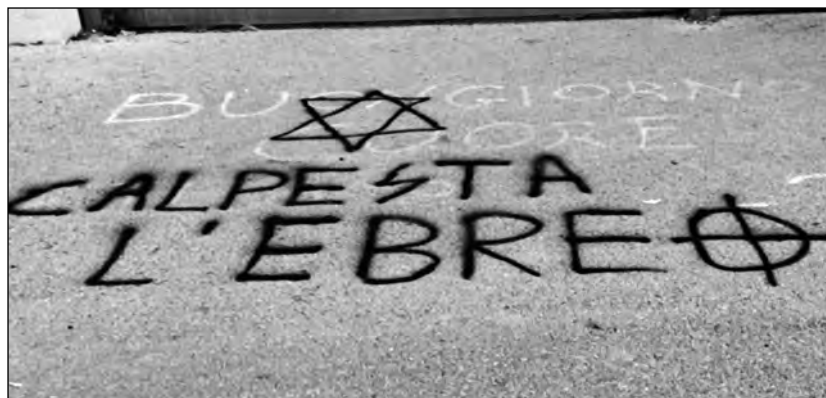
„Taposd el a zsidót” – korábbi antiszemita firkálmány valahol Olaszországban

Rómában az ókortól létező zsidó negyed épületeinek falaira Dávidcsillagokat és horogkeresztet festettek fel, pontosan ott, ahol nemrég