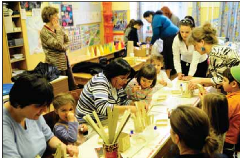
Sláchmoneszygártás a Wesselényiben