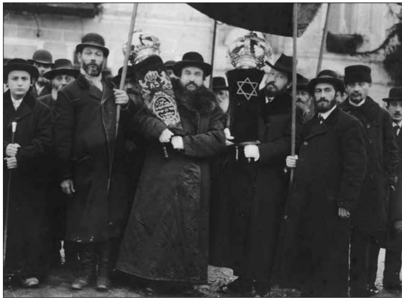
A zsidók a Tórárt viszik ki öfensége Frigyes főherceg elé – 1915–1916. A frontot folyamatosan látogatták az uralkodó családok. Ezen a felvételen egy „valószínűleg anektált város” rabbinátusának tagjai „tisztelgetek” a Tórával Frigyes főhercegnek, amikor az kinézett a frontra.

A kutatócsoport szervezi és egyben fel is gyorsítja az ilyesfajta hazai vizsgálódásokat – teszi hozzá a professzor. A rabbiképző intézet kutatócsoportját Staller Tamás alapította. Ekkor döntöttek úgy, újraindítják a Magyar Zsidó Szemlé (a folyóirat a háború előtt a Rabbiszeminárium jeles tudományos kiadványa volt). 2007-ben a kutatócsoport fő törekvése az egymástól függetlenül dolgozó tudósok, kisebb műhelyek megszervezése volt. Összehozta a hasonló tematikával foglalkozó kisebb csapa-