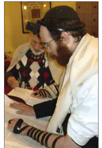
Nagyfuvaros: kettős ok a vidámságra