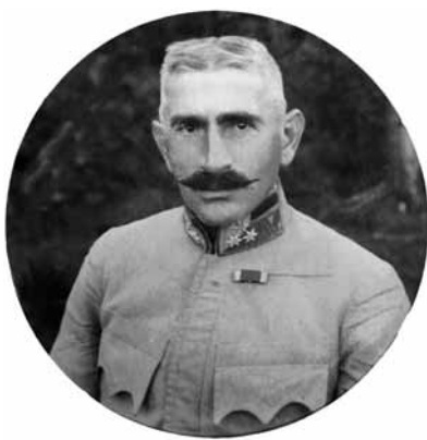
Bauer Gyula korabeli portréja – nemes krupieci Bauer Gyula tábornok. Kitüntetései: Jubileumi Kereszt, Jubileumi Érem, III. o. tiszti szolgálati jel. 1915-től a somogyi „rossebes” 44. cs. és kir. gyalogezred legendás parancsnoka, a Vaskorona Rend lovagja. Sírja a Farkasréti izraelita temetőben található, rajta a csatkiáltása: „Előre, rossebes!” Az egyetlen izraelita hiten maradt katonatiszt nemes síragárdi Zöld Márton mellett, akit Horthy hajlandó volt tábornoki jelleggel feldisznítani.

A kutatócsoport munkájának köszönhetően öt év alatt több száz publikáció, 25 könyv látott napvilágot. A könyvbemutatók, műhelyek, szabadegyetemek révén rendszeresen kapcsolatba kerülhetett a társadalom szélesebb, érdeklődő rétegeivel. Remek példája ennek Róbert Péter történésznek, az ORZSE oktatójának könyve, az Egyenlő jog a hősi halálra , amely a magyar zsidók részvételét mutatja be az első világháborúban. A kötet maradandó sikert aratott, az utolsó példányig elfogyott. Az ilyen tudományos eredmények bizton számíthatnak a szélesebb olvasóközönség érdeklődésére.