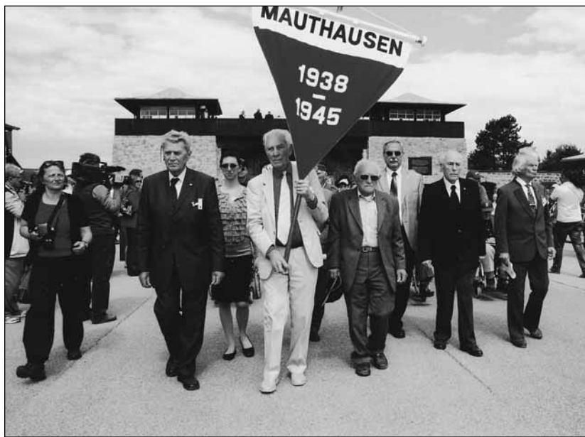
A mauthauseni koncentrációs tábor felszabadulásának évfordulóján a Mauthauseni Nemzetközi Bizottsággal az élen vonultak be a megemlékezés terére