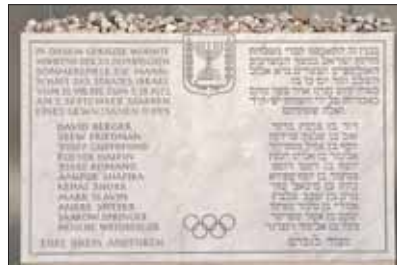
Émléktábla Münchenben: itt laktak...