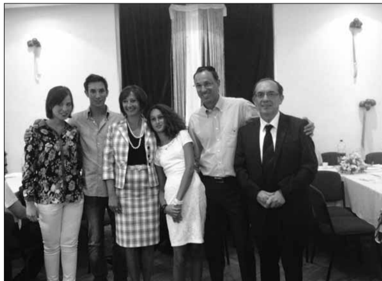
Bát micva. A család és a főrabbi