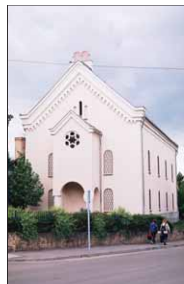
A tatai zsinagóga

A vészkorszak idején, 1944 júniusában, a tatai zsidókat is a komáromi erdőben létesített gettóba zárták, majd 13-án és 16-án két transzporttal deportálták őket. Az Auschwitzba hurcolt 650 ember közül csak néhányan éltek túl a holokausztot.