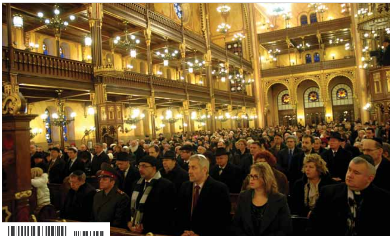
Túlélők és utódaik