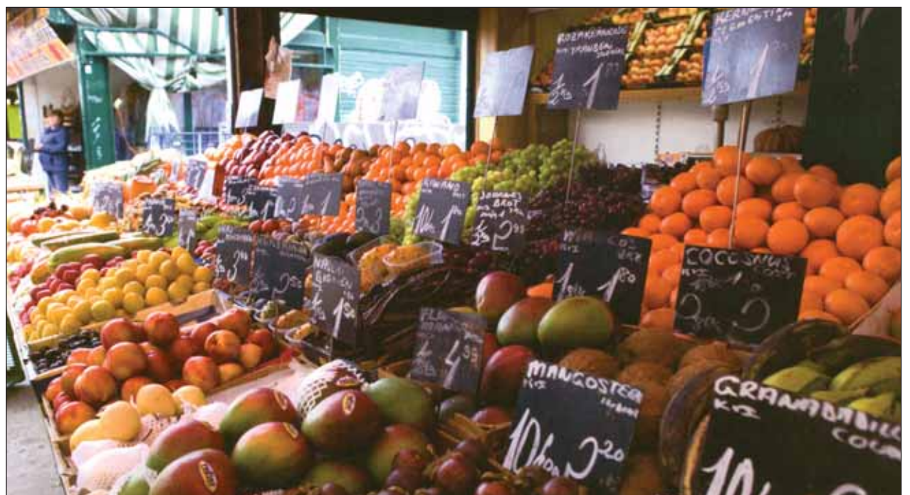
Tu bisváti kínálat