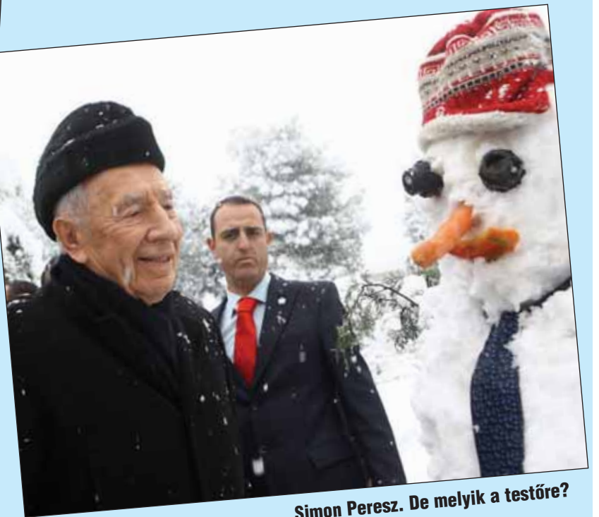
Simon Peresz. De melyik a testőre?