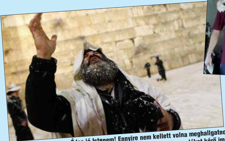
Édes jó Istenem! Ennyire nem kellett volna meghallgatnod a Gesem-bencsolásunkat! (csapadékokat kérő ima)