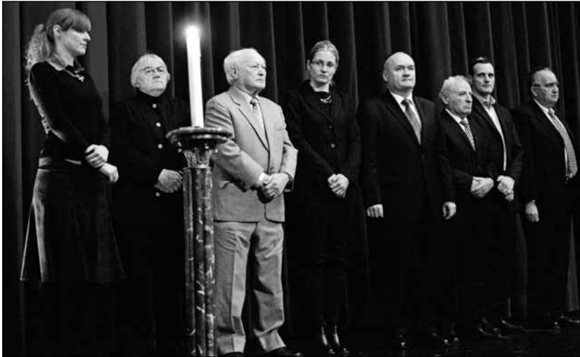
Az Uránia Nemzeti Filmszínház színpadán

1945-ös felszabadításának napját, hogy a jövő nemzedékei megismerjék a hatmillió, túlnyomórészt zsidó áldozatot követelő náci tömeggyilkosságok történetét. Magyarországon az idén tartották az eddigi legnagyobb szabású megemlékezésorozatát.