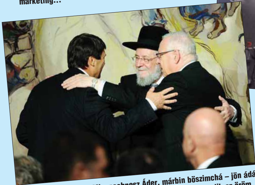
Misenechnessz Áder, márbín böszimchá – jön ádár hónapja, sokasodik az öröm...