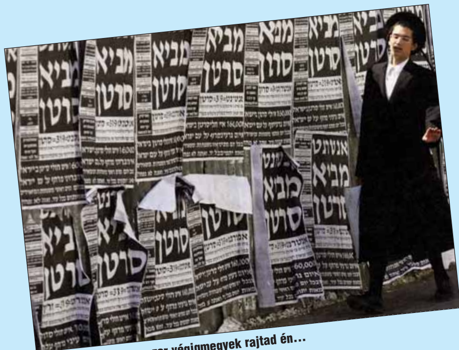
Böné Börák, ha egyszer végigmegegyek rajtad én...