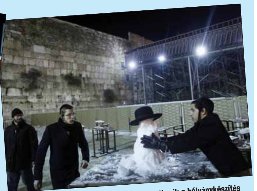
Tél a Méa-Searímban. Rájuk nem vonatkozik a bálványkészítés tilalma?