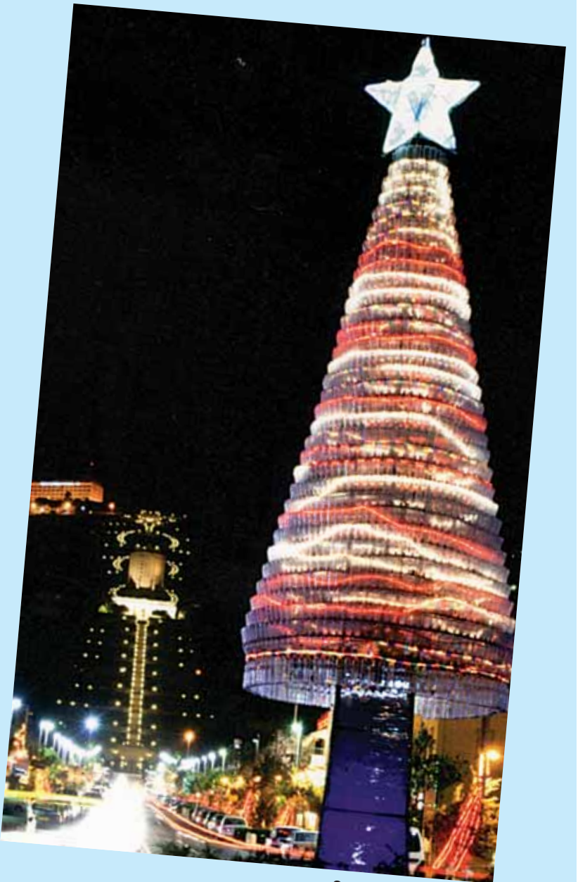
Stille Nacht – Haifán