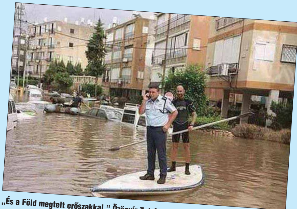
„És a Föld megtelt erőszakkal.” Özönvíz Tel-Avivban