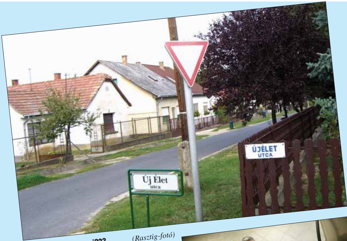
Élőről utcát elnevezni???