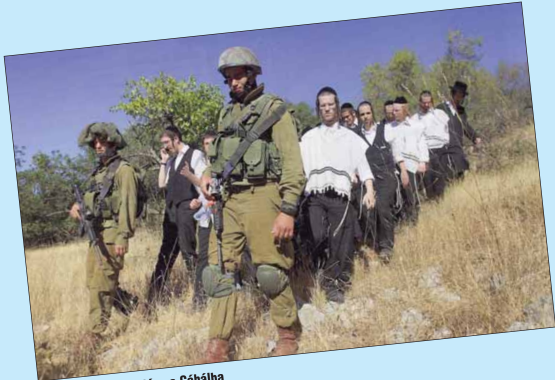
Vallásosak bevonulása a Cáhálba

כתיבה וחתימה טובה חברה קדישא CHEWRA KADISCHA Heiliger Verein für fromme und wohltätige Werke, gegründet 1764 wünscht allen Mitgliedern und Gönnern ein glückliches Jahr 5773