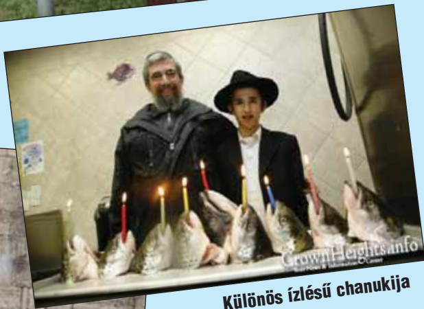
Különös ízlésű chanukija