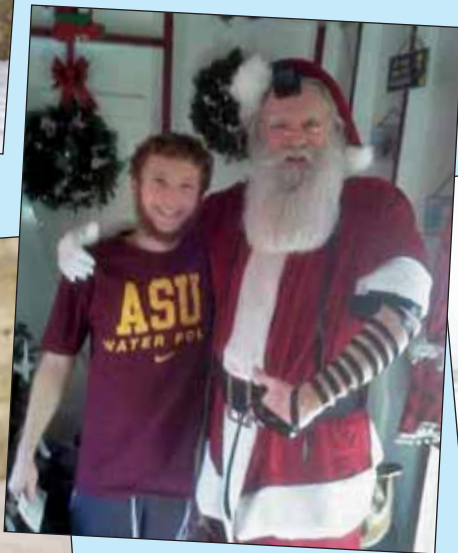
Identitászavar. Nem a pesti zsidónegyedben láttuk