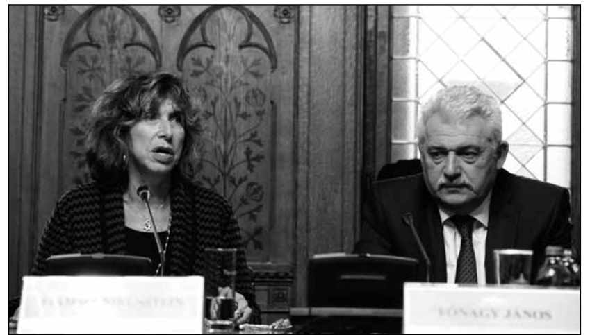
Fiamma Nirenstein és Fónagy János

Az olasz politikus közölte: tájékoztódtak a magyarországi romák és zsidók elleni rasszista és diszkriminatív megnyilvánulásokról. Leszögezte: nincs egyetlen ország sem Európában, ahol egy újságcikk a romákat az állatokkal tekintet-