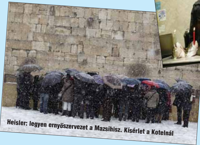
Heisler: legyen ernyőszervezet a Mazsihisz. Kísérlet a Kotelnál