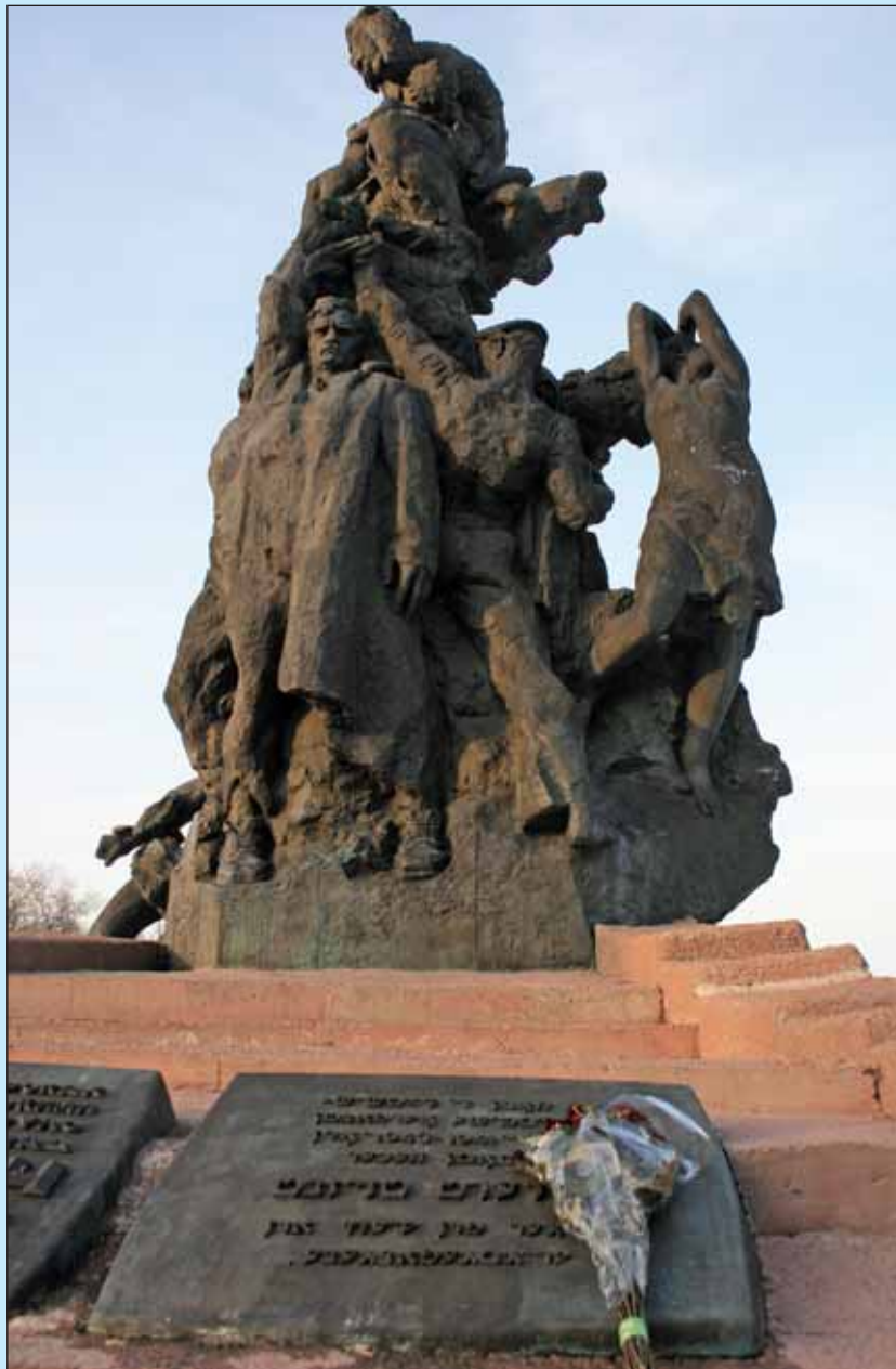
Babij Jár (Cikkünk a 3. oldalon)