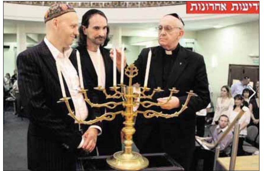
Olasz szülők gyermeke, Argentínából jött, Rómában pápává választották. Képünkön Ferenc (jobbra) a Buenos Aires-i zsidó közösség chanukkaünnepségén.