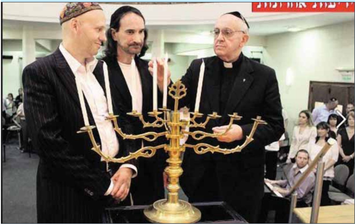
Chanukkai gyertyagyújtás Buenos Airesben a későbbi Ferenc pápával (jobbra) (Összeállításunk az 5. oldalon)