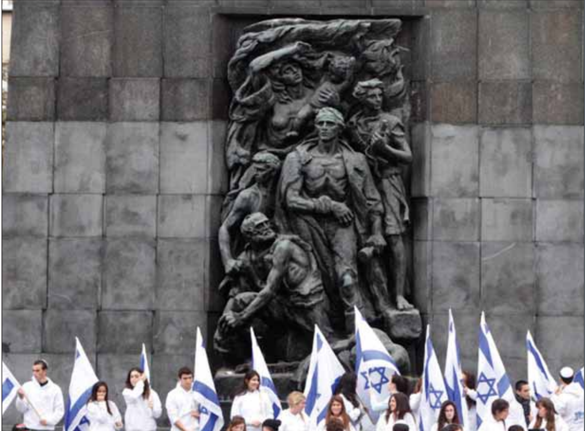
70 éve, 1943 áprilisában tört ki a varsói gettófelkelés (Cikkünk az 5. oldalon)