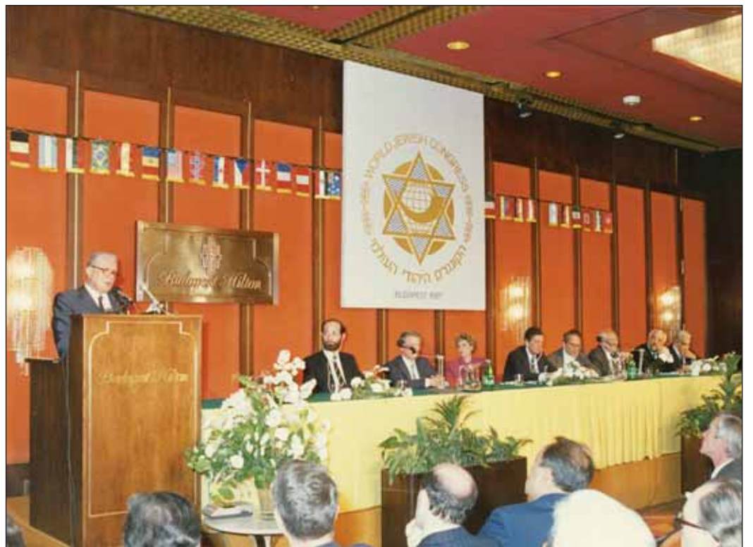
1987: A ZSVK Végrehajtó Bizottsága Budapesten ülésezett