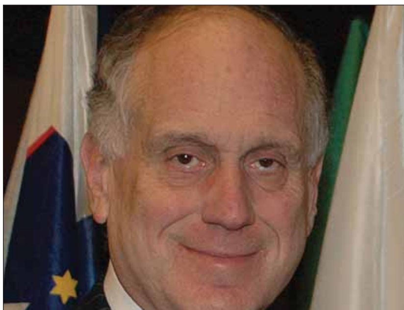
Ronald S. Lauder, a Zsidó Világkongresszus elnöke

Emellett a Zsidó Világkongresszus sikeresen lobbizott az ENSZ-nél és a kormányoknál Izrael megalapításáért. A Zsidó Világkongresszus 1948 után figyelmét az arab országokban élő zsidó menekültekre fordította, valamint ráirányította a nemzetközi közvélemény figyelmét a Szovjetunióban élő zsidók helyzetére, akik végül engedélyt kaptak arra, hogy Izraelbe költözze-