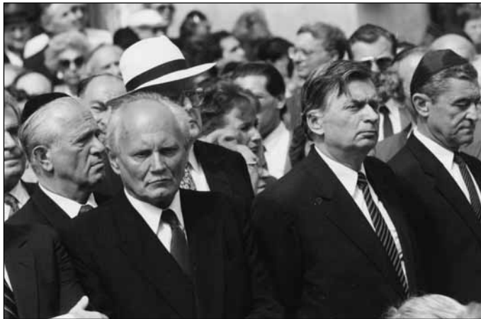
A Fa felavatásán