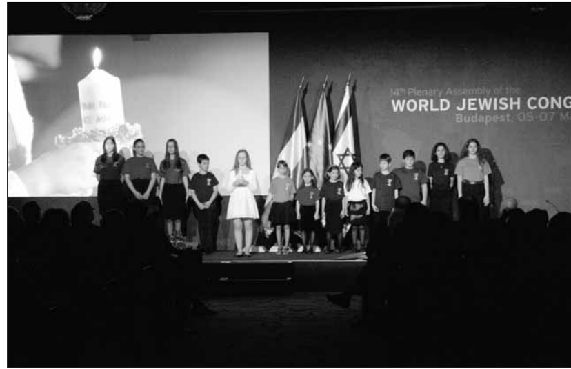
Szólnak a himnuszok. A Lauder-kórus

Ezután következett a miniszterelnök nagy érdeklődéssel várt beszéde.