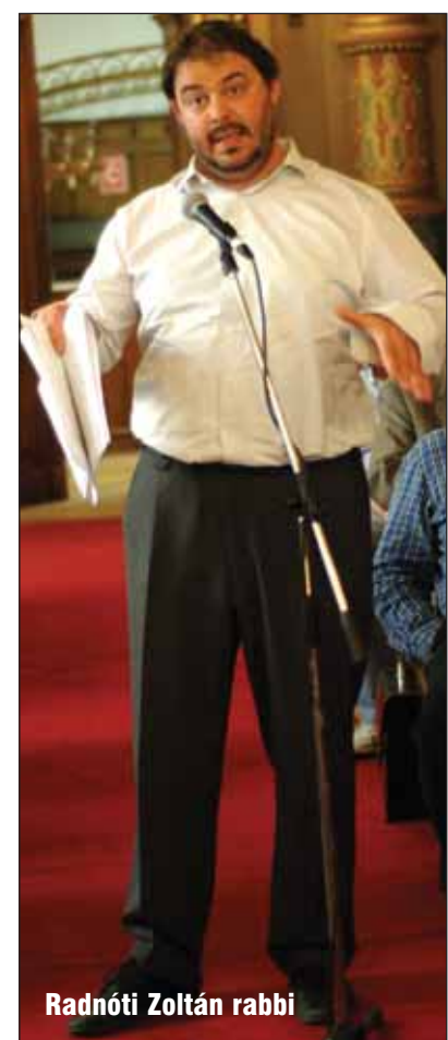
Radnóti Zoltán rabbi

A Jewinform egy többéves, 2015-ben lejárat szerződés értelmében megjelenő költség, és csupán két minimálbért fizet a BZSH. A biztonsági szolgálatot 2013-ban már a Mazsihisz közösen, költségmegosztással működtetik. Az újpesti szakszociális otthon túlméretezett a létszámhoz képest, bevételt pedig nem termel, a nappali ellátást jelentő klubokat a létrehozás idejében 190 főre tervezték,