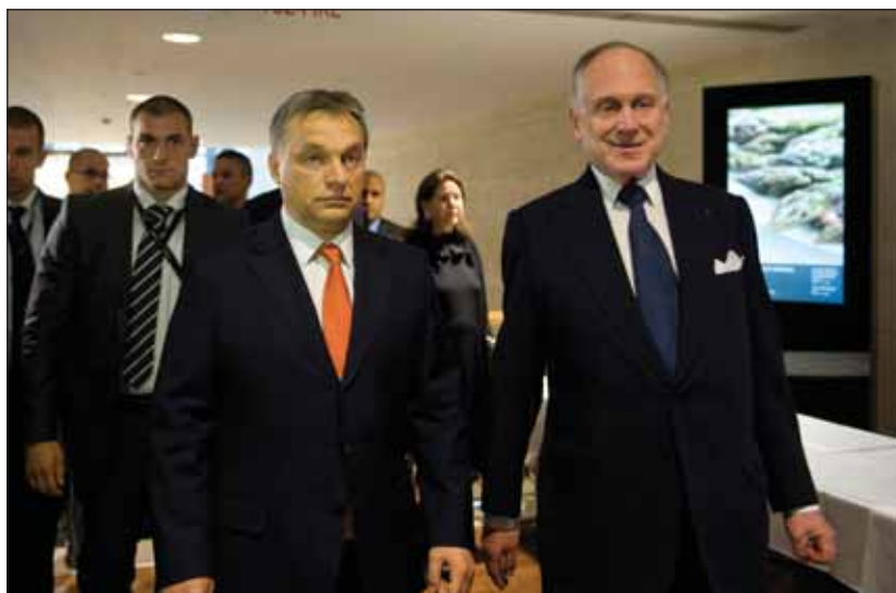
Orbán Viktor és kíséretében Ronald S. Lauder

Lauder ezt követően bemutatta az est utolsó szónokát, az Izrael kormányát képviselő Szilvan Salom energiaszabályozási minisztert, akinek nevéhez fűződik egyebek mellett az ENSZ által bevezetett Nemzetközi Holokauszt Emléknappal, melyet minden évben Auschwitz felszabadulásának évfordulóján tartanak.