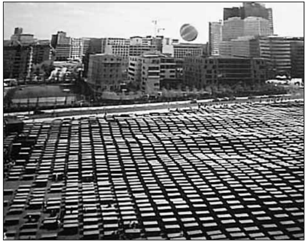
Hullámzó sírkötenger. Monumentális mártíremlékmű Berlin szívében

Sokszor hallott tragikus eseményekre asszociál. Amikor ott jársz, úgy tűnik, szinte nem lehet kijönni belőle. Fogva tart az emlékezet, a fájó, a tragikus történelem.