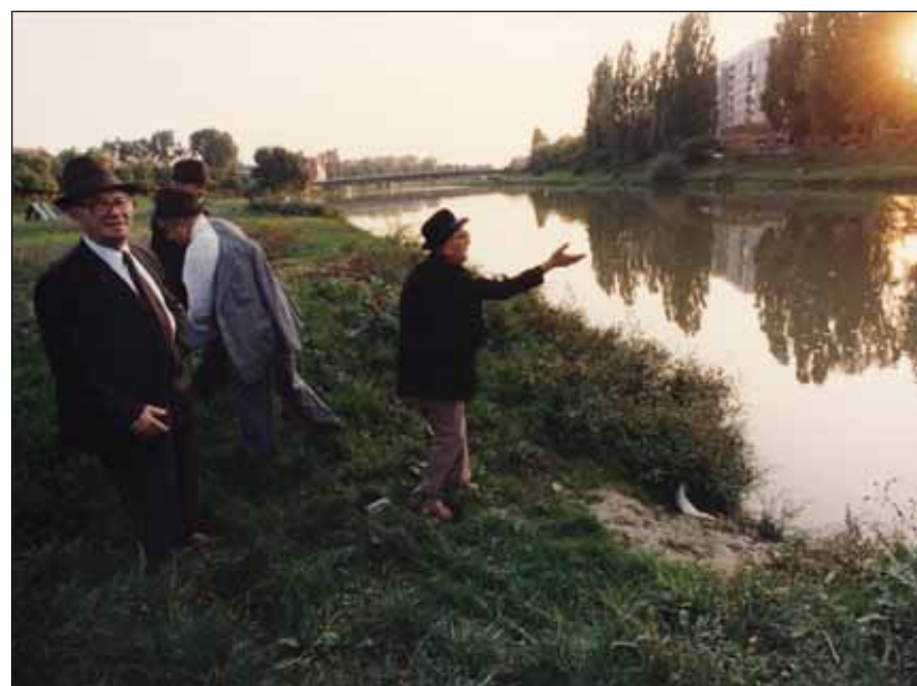
Táslich. Vessük bűneinket a folyóba