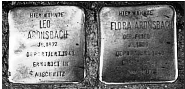
Botlatókövek Berlinben (a szerző felv.)

Mit tettek akkor népünkkel! Mi lett a sorsuk? Szerencsére Európában nagyon sok helyen található botlatókő. Magyarországon tizenkilenc városban is. A fővárosban tizenegy kerületben. Eddig Európában több mint húszezer botlatókövet helyeztek el. Ilyenkor, a Nagyünnep környékén, közel a Mázkirhoz, első feladatunk az emlékezés. Rájuk, akiknek vagy van emlékművük, vagy nincs, azokra, akiknek emlékét, nevét kőbe vésték, s azokra, akiknek még emlékük sincs, vagy nevüket sem ismerjük.