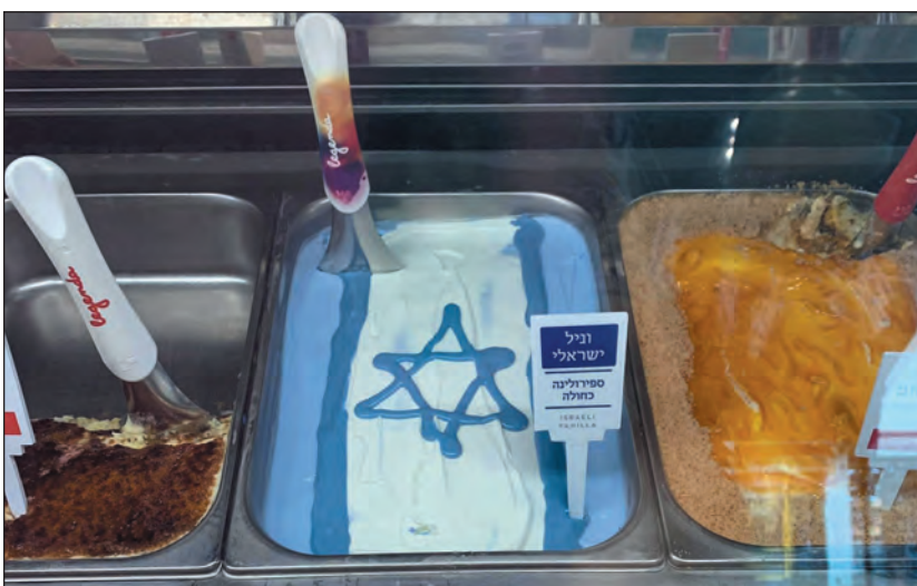
Egység. Ezekben az időkben minden izraeli

És akkor elmesélem, hogy micsonda változásokat láttam ez alatt a három nap alatt. Először is, aki már