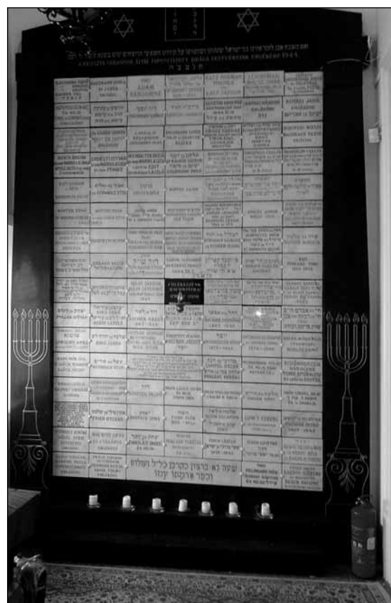
Mártírfal az ország legnagyobb mártíremlékművében