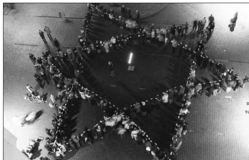
Chanukkai élőkép Tübingen főterén. Így emlékeznek a város zsidó mártírjaira

képes vagyok-e megbocsátani? Igen, én. Személyesen.