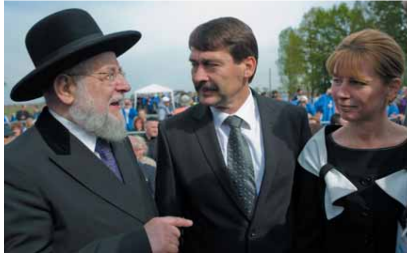
Áder János és felesége Méir Lau társaságában

Ő volt az a pápa, aki az auschwitzi haláltáborban történeteket az ördög diadalának, a történelem leg-sötétebb fejezetének nevezte. Ő volt az a pápa, aki Auschwitzot olyan helynek nevezte, amely a szellemet, a lelkiismeretet, a szívet hatalmába kerítő sötétség tragikus következményeinek állít emléket az utókor számára. És ő volt az, aki arra is figyelmeztetett minket, hogy meg kell szabadítanunk az embereket a rasszizmus, a kirekesztés, a szolgaságba döntés, az idegengyűlölet rémképétől.