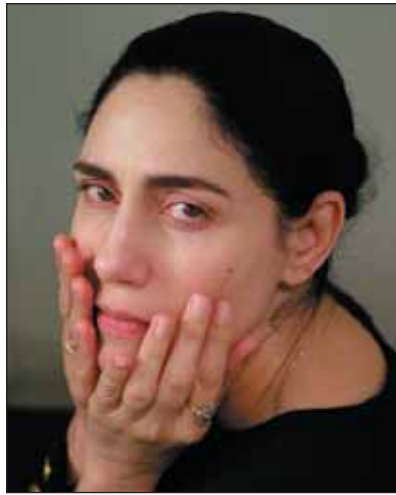
Évek óta vár a gettre

Meggyőződésem, hogy Izraelben nem a Meá Seárimban volt a premi-