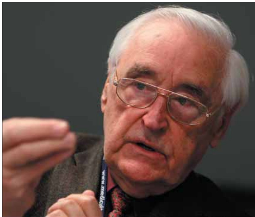
Czeizel Endre: a zsidók tudnak valamit

Kertész Imrét azonban nem vette körül tehetsős család, remek iskolá-