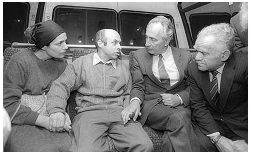
A „kicserélt” Sharansky. A volt fogoly és felesége mellett Simon Peres és Jichak Samir

– Figyeljen – mondtam –, biztos vagyok benne, hogy valahol megvan az a menóra. Számomra nagyon fontos lenne, hogy megünnepelhessem a chanuka utolsó estjét. Ha megengedi