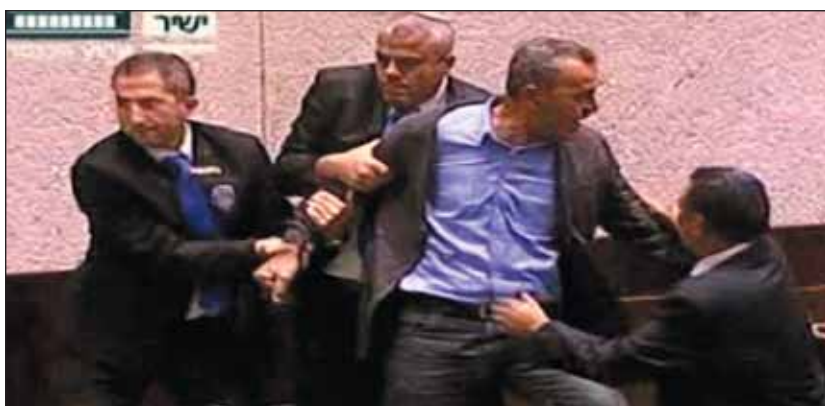
Jelenet a kneszetből

Az új alaptörvény elfogadott elveiből állítják össze a törvényjavaslat szövegét, amelynek kinyilvánított célja Izrael zsidó jellegének erősítése, bírálói szerint demokratikus jellegének rovására. Az arab nyelv a javaslatok értelmében nem számít az ország hivatalos nyelvének, noha Izrael mintegy ötödének ez az anyanyelve.