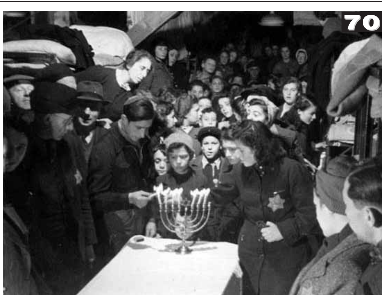
Gyújtás szomorú körülmények között