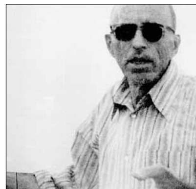
A Moszad kétszer mellőlött