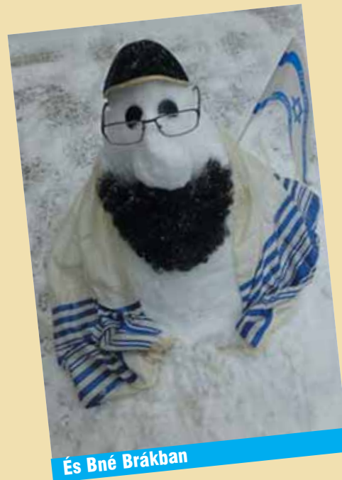
És Bné Brákban