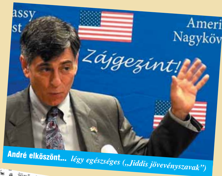
André elköszönt... légy egészséges („Jiddis jövevényiszavak”)