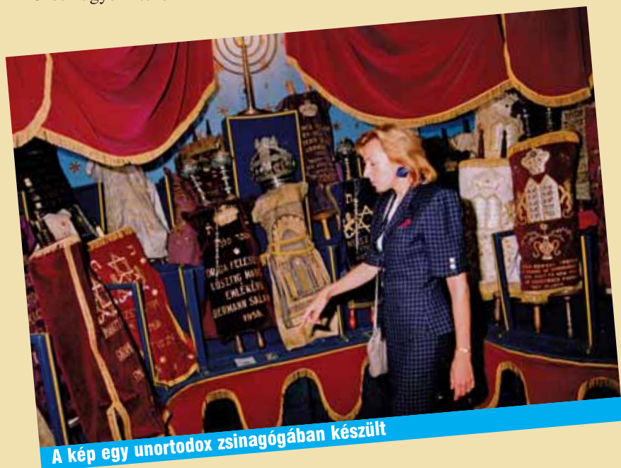
A kép egy unortodox zsinagógában készült