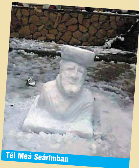
Tél Meá Seárimban