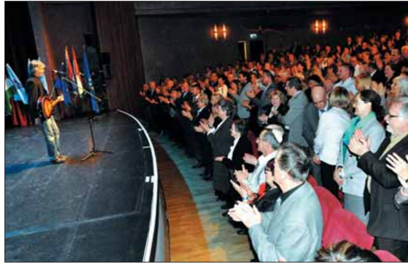
Bródy János. „Lesz még magyar köztársaság, / álljunk fel hát érte”

A záró műsorszám Bródy János két dala: az egyik a Kondratyev-féle ciklus nyomán a társadalmi jelenségek ismétlődéséről szól – a hatalom mindenkor arroganciájára, a vele szembeni éberségre hívja fel a figyelmet. A másikban felhangzik az optimista refrén: „Lesz még egyszer társaság, / lesz még magyar köztársaság, / álljunk fel hát érte.” A nóta végét valóban mindenki állva éneklő együtt az előadóval.