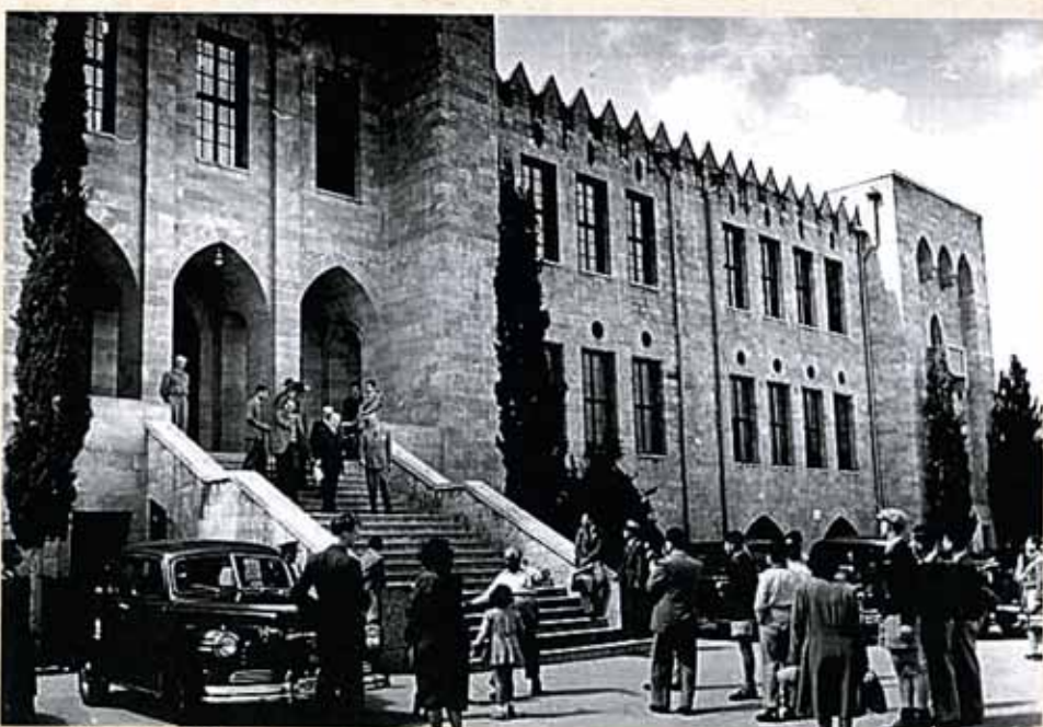
The Technion, Haifa, 1955