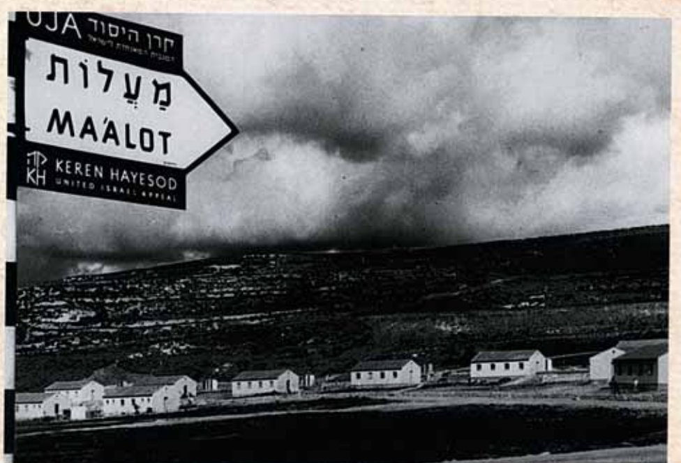
Ma'alot, the Galilee, 1957