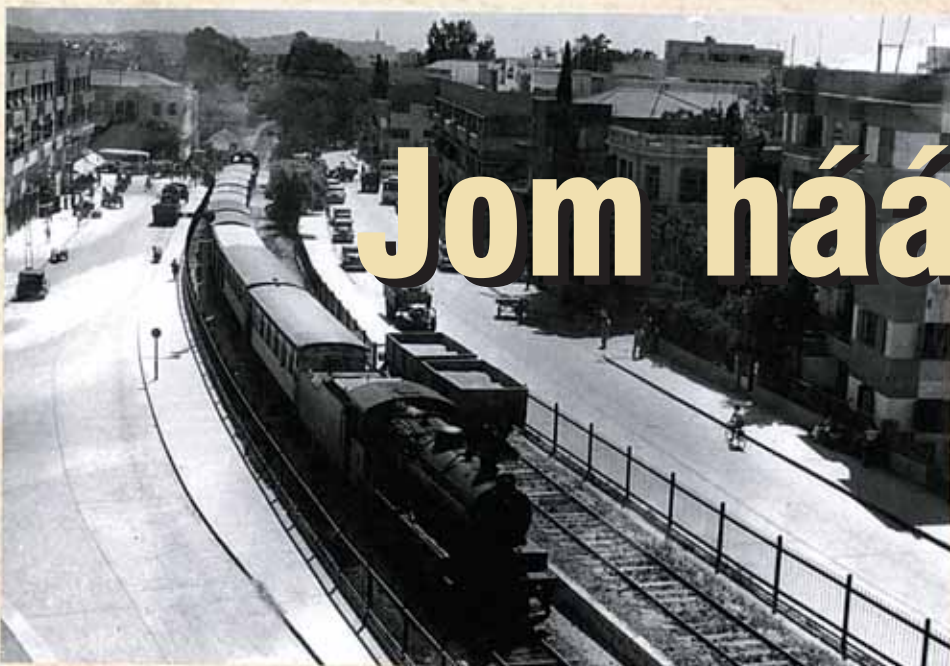
Mandate-era train, Tel Aviv, 1940