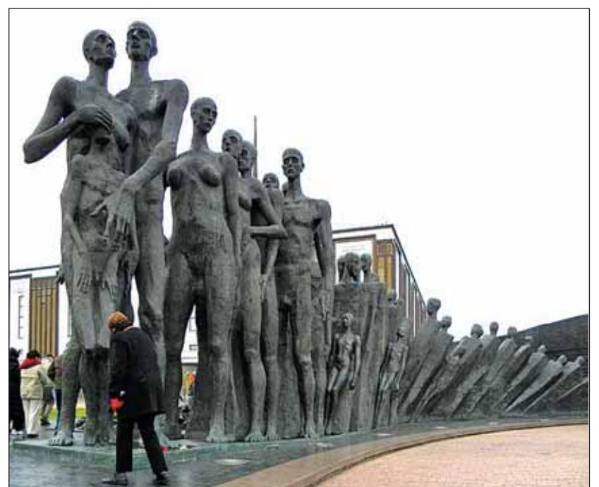
Mártírelmékmű a moszkvai Memorial Zsinagóga előtt

Angela Merkel még nem szólalt meg az ügyben. Nehéz is mit mondania: ugyanis híres arról, hogy adáz ellensége a diktatúra és a személyi kultusz minden formájának. Történelmi népszerűségét mostanáig nem utolsó sorban szerénységének és puritánságának köszönhette. És az is biztos, hogy választásokat nem a filmvásznon, hanem politikájával akar nyerni.