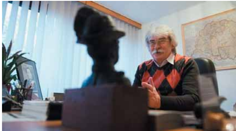
Sokatmondó kép. Szakályék kezelik kárpótlási aktáinkat

Sok aggodó jelzést kapott a Magyarországi Zsidó Hitközségek Szövetsége a Veritas új szerepéről illetően, és nem csak zsidó honfitársaink részéről – mondta el az atv.hu-nak Heisler András. A leglátogatottabb zsidó érdekképviselet elnöke ide sorolja a Közgyűteményi és Közművelődési Dolgozók Szakszervezetének (KKDSZ) tiltakozó nyilatkozatát is.