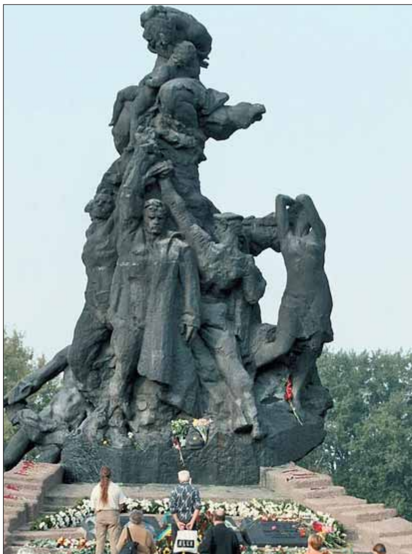
Emlékmű Babij Jarban