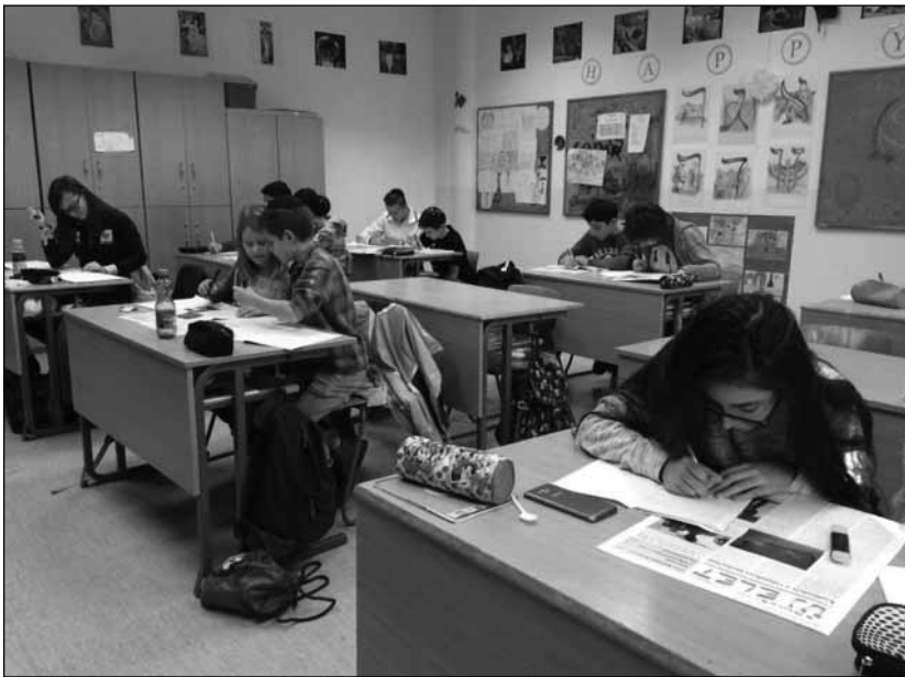
A Scheiber Gimnázium 6. a osztálya a magyar zsidó sajtóról tanul épp, s az Új Élet cikkeket olvassák a diákok. Feladatokat kaptak, és lelkesen oldják meg.