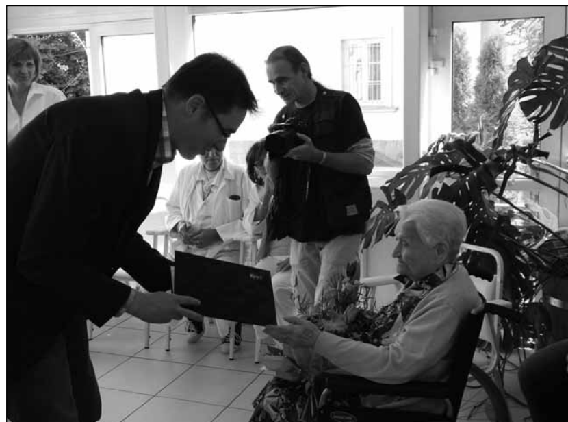
Karácsony Gergely polgármester köszönti az egyik ünnepeket