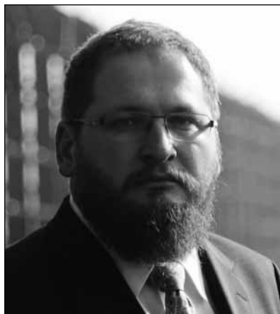
Piotr Cywinski, az auschwitzi múzeum igazgatója

közélet több képviselője is megjelent. Murat Hazinedar, a város Besiktas kerületének polgármestere beszédében azt kívánta, hogy a chanukkai gyertyák fényei világítsák meg az egész világot. Ishak Ibrahimzadeh hitközségi elnök a török államnak a vallási kisebbségek iránti toleráns politikáját méltatta. Recep Tayyip Erdogan köztársasági elnök üzenetében hangsúlyozta, a zsidók nélkülözhetetlen részei a tö-