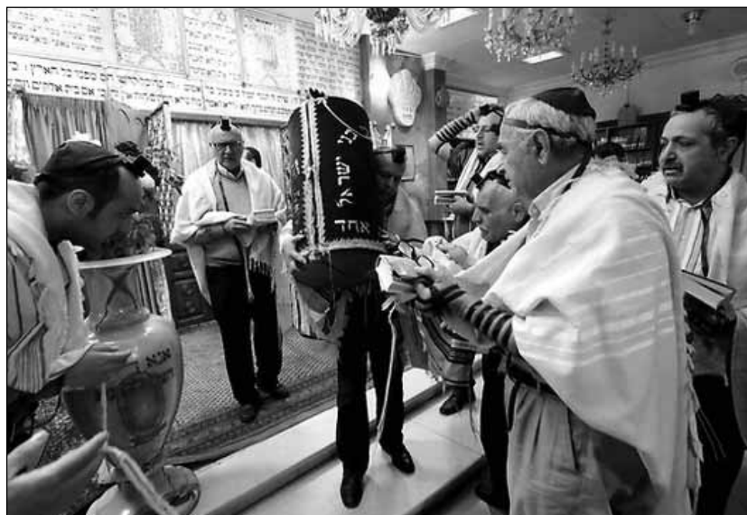
Az iráni zsidó közösség tagjai hétről hétre ellátogatnak az ország valamelyik zsinagógájába. A képen a teheráni Palesztina utcában található Abrishami zsinagógában zajlik az istentisztelet.

Mauricio Macri új argentin államfő nem fellebbezi meg azt a bírósági döntést, amely alkotmányellenesnek nyilvánította azt az argentin–iráni vegyes bizottságot, amelyet az előző