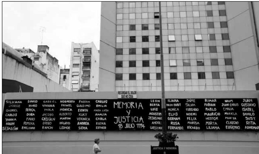
Az AMIA központ Argentínában

rök társadalomnak. Az ünnep alkalmából békét, boldogságot és jólétet kívánt a közösség tagjainak.