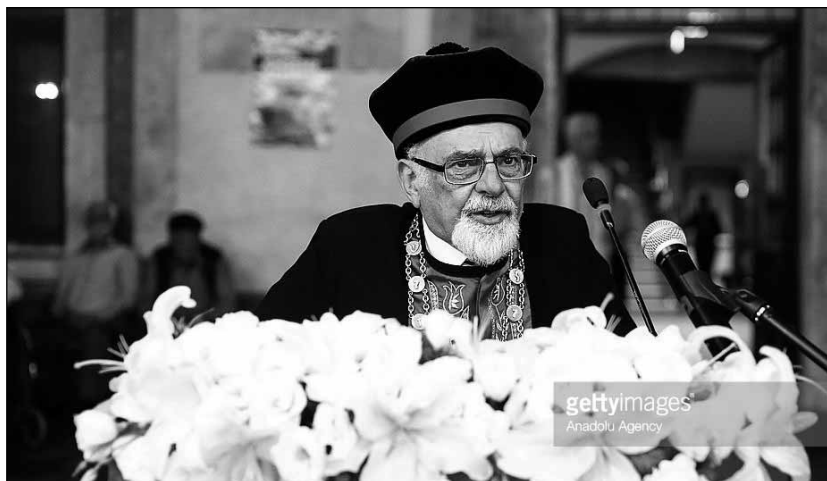
Ishak Haleva isztambuli főrabbi

Az Isztambulban megjelenő Salom újság tájékoztatása szerint először rendeztek nyilvános chanukkát az országban, mégpedig a nyolcadik gyertya meggyújtásakor. Az ünnepséget az isztambuli Ortaköy téren tartották, ahol Ishak Haleva főrabbi és a hívők mellett a