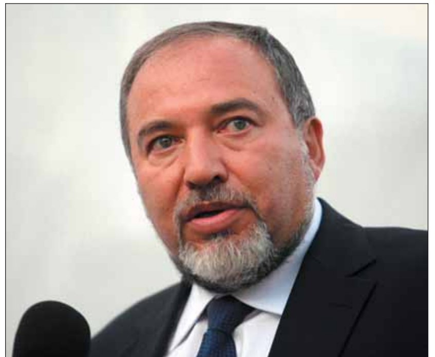
Liberman: Vissza a halálbüntetést!

A felek végül abban egyeztek meg, hogy a katonai bíróságok számára valamivel egyszerűbb teszik, hogy halálos ítéletet hozhassanak. Szándékuk szerint nem kell majd hozzá az eljáró bíróság összes tagjának egyetértése, elég lesz, ha a többségük támogatja.