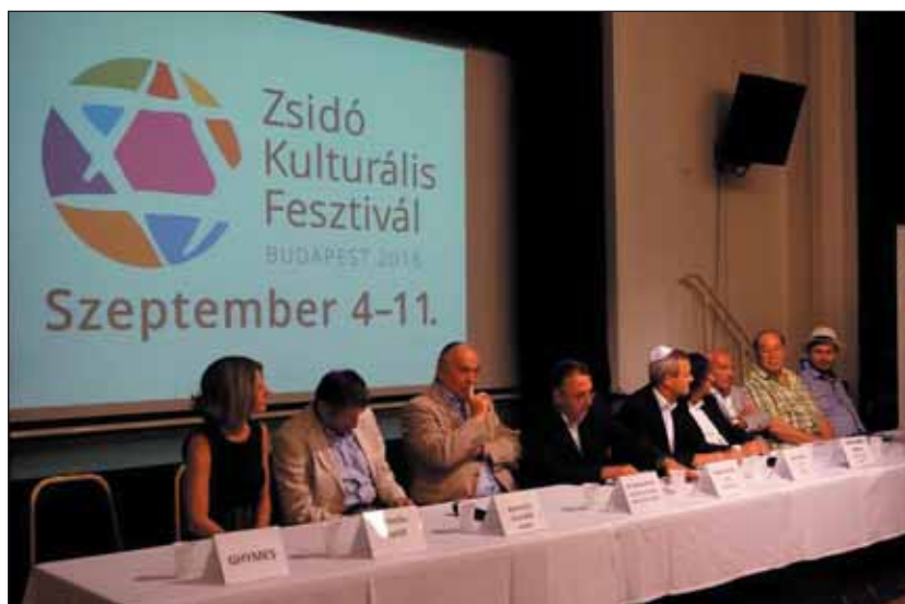
A Goldmark Terem színpadán

kultúrák keveredéséről és a megértésről szól. A zsidó vallás szakrális helyei szeptember 4. és 11. között a nemzetközi fellépők mellett olyan produkciókat fogadnak be, melyek a magyar és a zsidó kultúra szerves összefonódásáról szólnak.