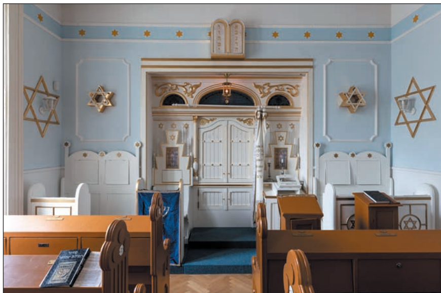
A Thököly úti zsinagóga belső tere