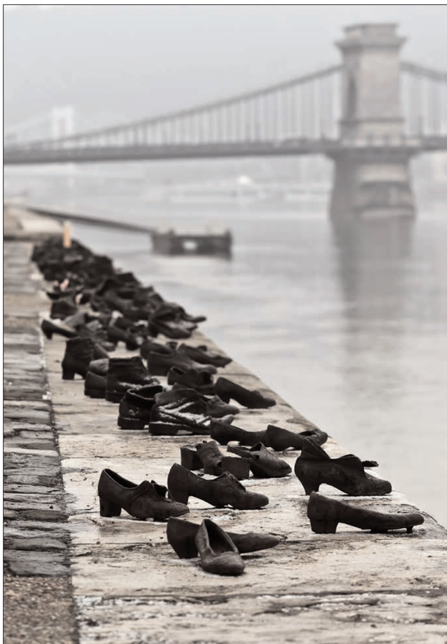
Cipők a Duna-parton. Emlékmű a pesti Duna-parton, Pauer Gyula és Can Togay alkotása (Forrás: Wikipédia)