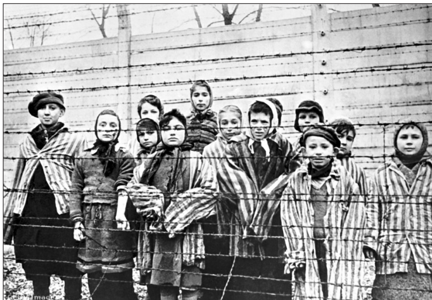
Gyerek túlélők Auschwitzban 1945. január 27-én