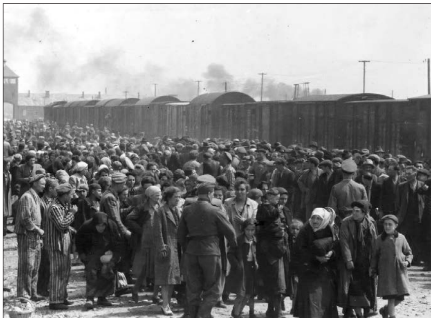
Magyar deportáltak érkezése az auschwitz-birkenauai koncentrációs táborba