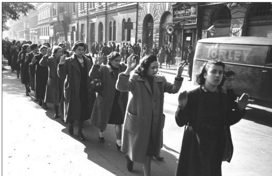
Letartóztatott zsidó nők menete a budapesti Wesselényi utcában, 1944. október 20.