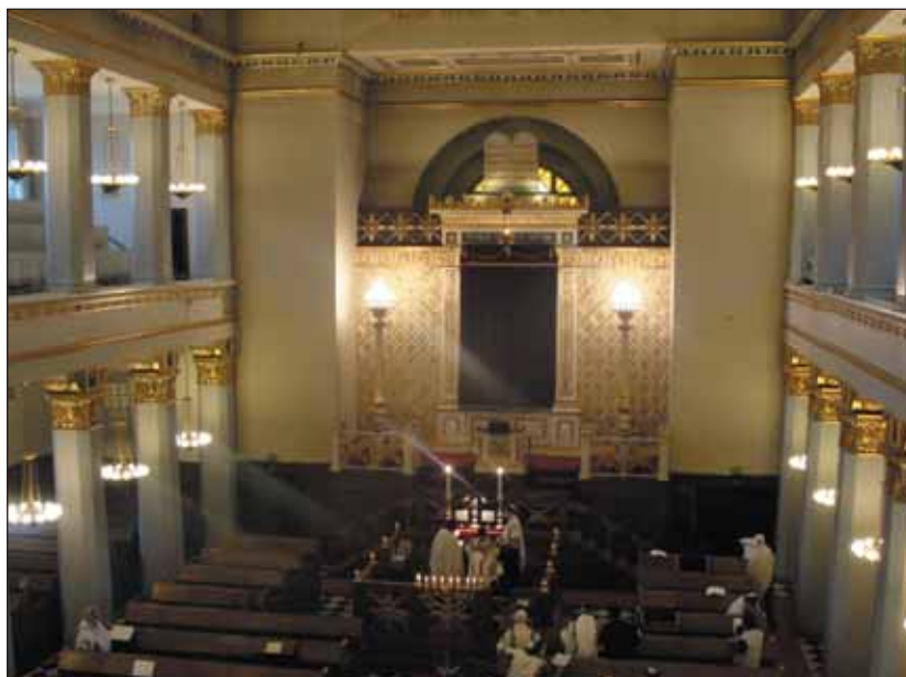
Dánia: a katonák és rendőrök által őrzött zsinagóga Koppenhágában

A második világháború befejezése óta első ízben fordul elő Koppenhágában, hogy katonaságot alkalmaznak, és 2018 márciusáig a zsinagógát és Izrael nagykövetségét így őrzik. A két éve elkövetett terrorista merénylet óta a zsidó intézményeket rendőri egységek védik, melyeket most más feladataik miatt a biztonsági feladatokra kiképzett katonák tehermentesítenek. A közelmúltban a Biztonsági Szolgálat a legmagasabbra emelte a terrorfenyegetettség szintjét. Mintegy 8000 hittestvérünk él az országban, akik főleg a fővárosban és közvetlen környékén telepedtek le. A zsidók többsége askenázi, akik általában kelet- és közép-európai felmenőkkel rendelkeznek.