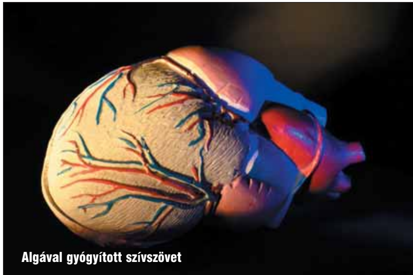
Algával gyógyított szívszövet

5. Leheletérzékelő mobil diagnosztika. Hosszám Haich , a haifai Technion műszaki egyetem professzora fejlesztette ki azt az apró, könnyen telepíthető berendezést, mely a leheletet elemezve gyorsan és kíméletesen azonosít betegségeket. A vizsgálati eredményeket mobilhálózaton keresztül küldi el kiértékelésre, melynek eredménye végül a kezelőorvoshoz jut el.