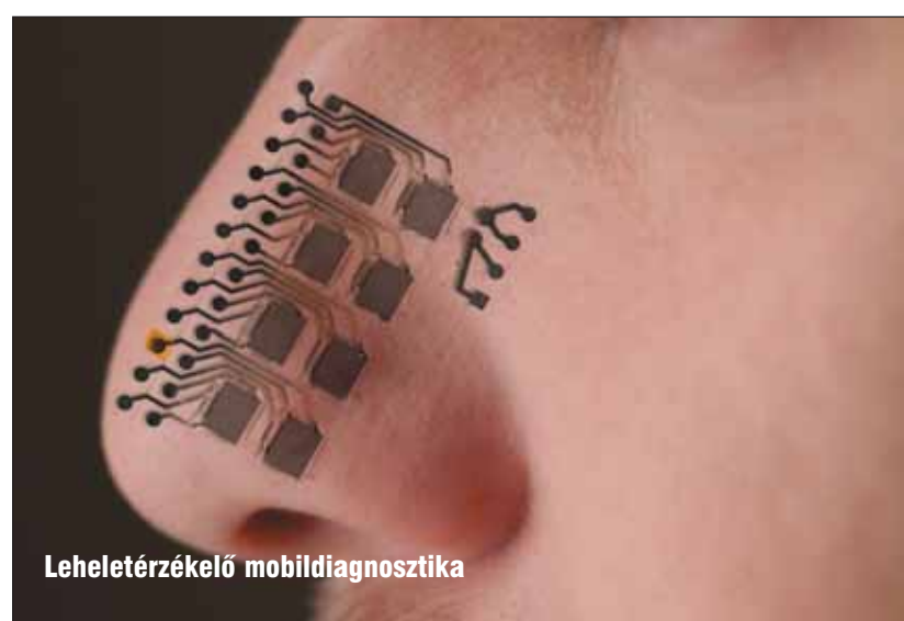
Leheletérzékelő mobil diagnosztika