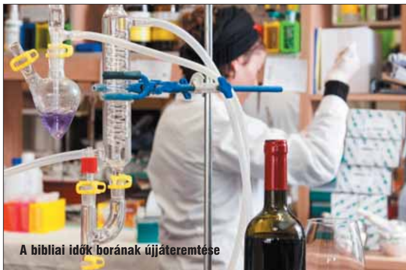
A bibliai idők borának újáteremtése