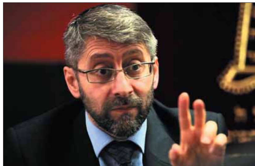
Franciaország: Haïm Korsia főrabbi is támogatta, hogy a botrányos szervezet élére zsidó kerüljön...