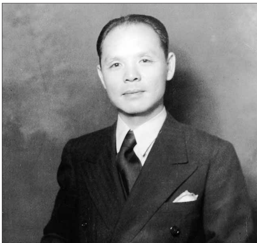
Csehország: Ho Feng-Shan segítette az európai zsidók menekülését

A Sanghaji Múzeum és az olomouci Palacky Egyetem Konfuciusz Intézete szervezésében kiállítás nyílt az 1933 és 41 között Európából Sanghajba menekült zsidók történetéről. A negyven tablóból álló anyag először Olomoucban (Olmütz) látható, majd később más európai városokban is bemutatják. A program előkészítésében részt vett a helyi hitközség is. A megnyitónapszéken levetítették a Ho Feng-Shan egykori bécsi főkonzul életéről cseh-kínai közös produkcióban készült filmet. A diplomata több ezer üldözöttnek adott kínai vízumot, és segítette Európából való menekülésüket. A Konfuciusz Intézet összeállította a Csehszlovákiából Sanghajba menekült zsidók névsorát is. A városból a náci 3500 zsidót deportáltak, és a végső megoldást alig háromszáz személy élte túl. A hitközségnek jelenleg 150 tagja van.