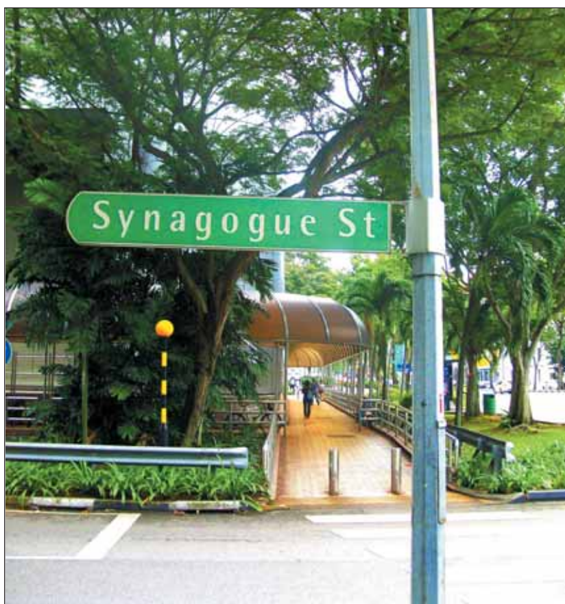
Szingapúr: Zsinagóga utca

Százéves a vlagyivosztoki Bét Sirma zsinagóga, az orosz Távol-Kelet egyik legrégebbi zsidó temploma. Az 1917-ben átadott épület 1932-ben történt kisajátításáig fogadta a hívőket. Később csokoládégyár, majd raktár létesült benne. A hatóságok 2005-ben visszaadták a zsidó közösségnek a templomot, melyet a közelmúltban Vlagyimir Kogan bankár anyagi támogatásával felújítottak és kibővítettek. A zsinagóga ünnepélyes felavatására 2015-ben került sor, amelyen Dmitrij Medvegyev orosz kormányfő is részt vett. Az első zsidók a 19. század végén telepedtek le Vlagyivosztokban. Mintegy ötezer hittestvérünk lakik jelenleg a városban, akiknek túlnyomó többsége vegyes házasságban él.