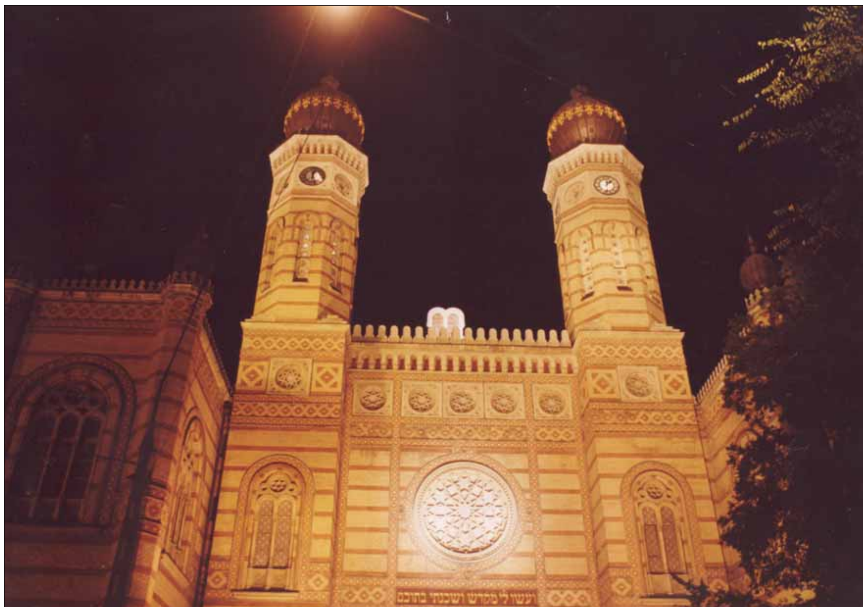
A történelem viharai többször akarták lerombolni