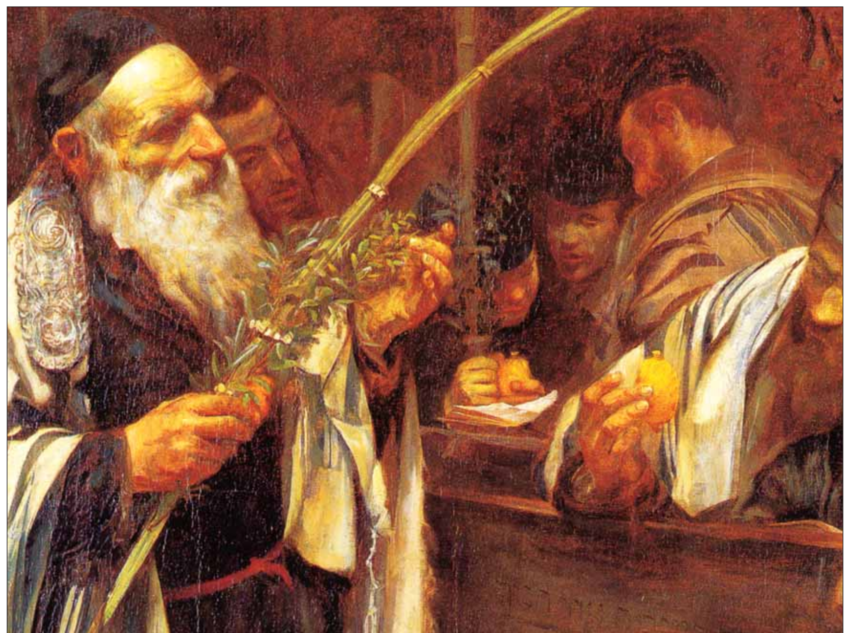
Szukkot a zsinagógában