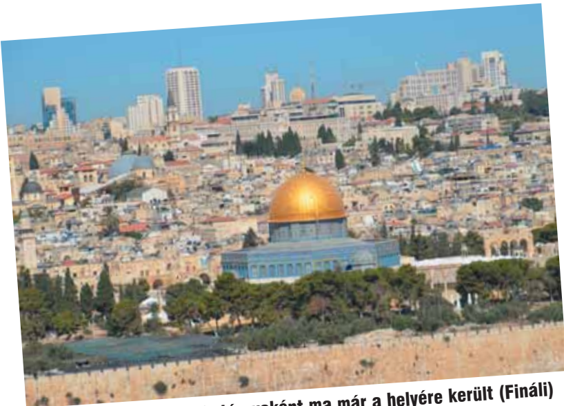
Izrael a kezdeti rajongás tárgyaként ma már a helyére került (Fináli)

A MAGYARORSZÁGI ZSIDÓ HITKÖZSÉGEK SZÖVETSÉGÉNEK LAPJA