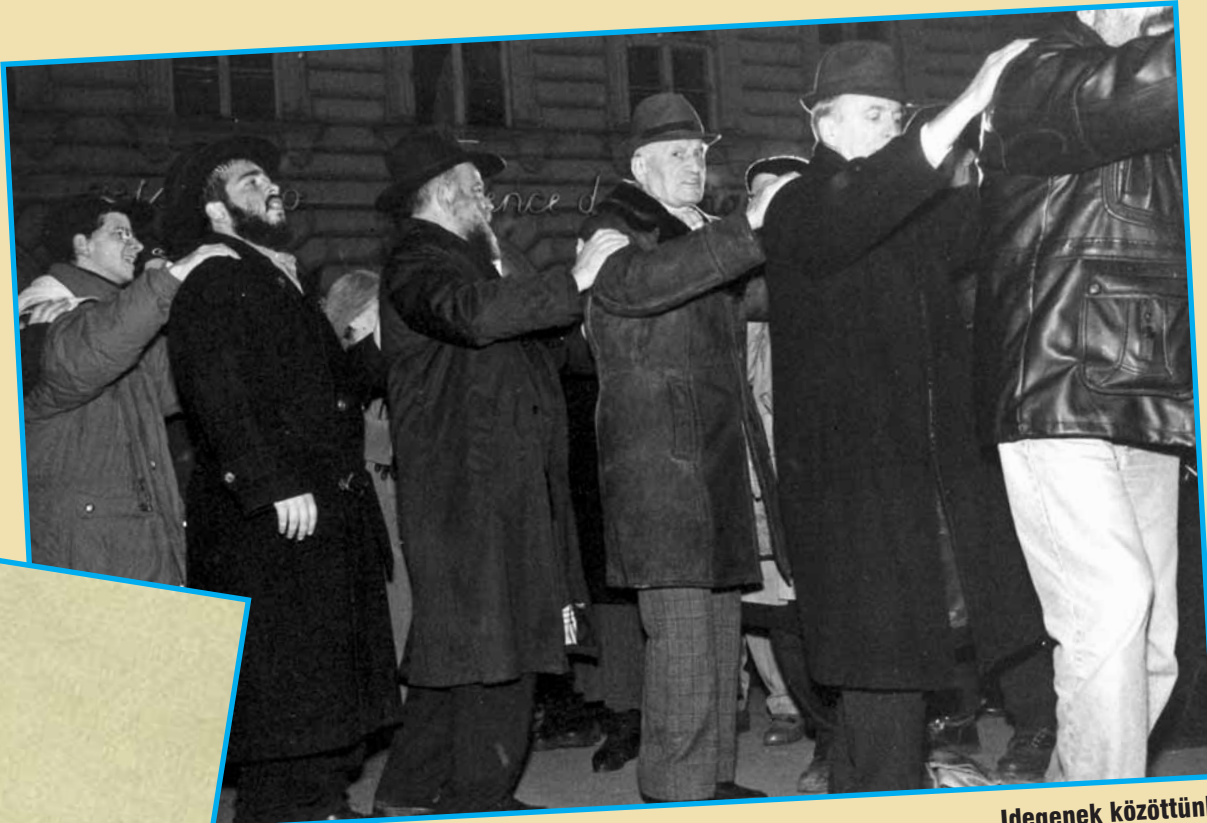
Idegének közöttünk (1990)