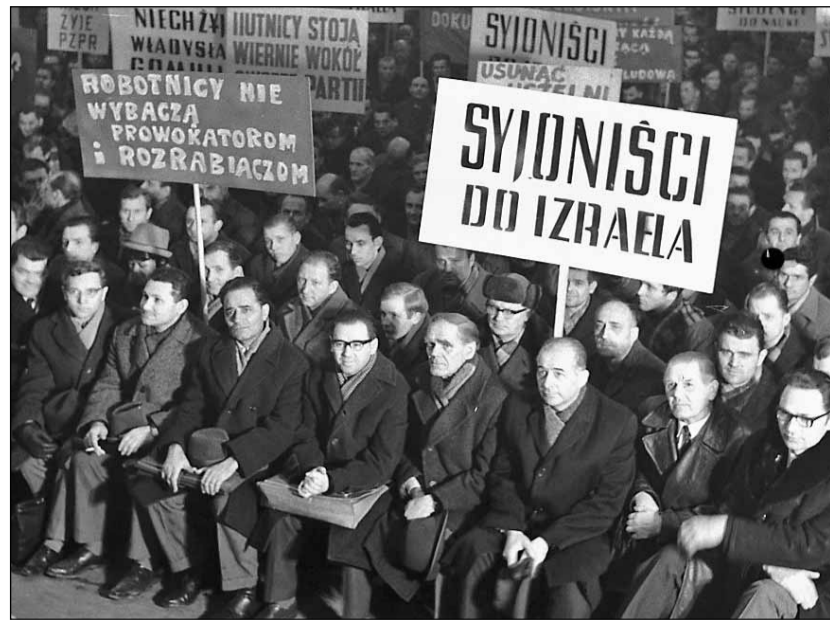
Izraelbe a cionistákkal – Nem csak pozícióikból, az országból is távozniuk kellett a lengyel zsidóknak

A kivándorlást kikényszerítő kampány elsősorban a zsidó értelmiséggel szemben folyik, és különösen azokban a nagy vidéki központokban, ahol tulajdonképpen inkább vizibilisek (láthatóak) – például Lodzban, Sziléziában. Innen indul el azután később a legtöbb kivándorló is. Az év tisztogatásaiban Varsóban keveredik a politika és az etnikai elem: leválthatnak vagy 500 párt- és állami vezetőt (köztük katonákat). Vidéken marad a majdnem tiszta etnika. Vannak felfogások, melyek szerint a Gomulkát eredetileg támogatók ilyen intenzív etnikai tisztogatást a kádarcserénél azért nem akartak. De felszabadultak, összegzödték különböző indulatok, reflexek. Különben hogyan hihették volna az emberek el, hogy egy egyébként békés, épülő országban ilyen sok „bujtatót, belső imperialista” van a vezetésben. Egyébként a legfelső pártvezetésben, Gomulka környezetében akkor már nincsenek zsidók, hiszen a csúcsok-