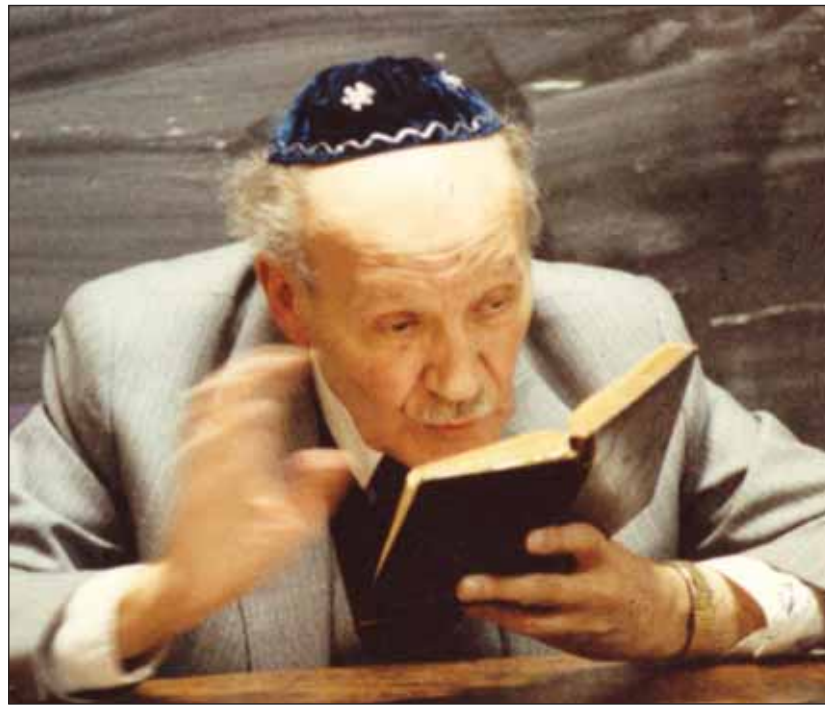
Emléke örökké él

Scheiber professzor számára a zsidóság a vallást, a kultúrát, a tudományt és a hovatartozást egyaránt jelentette. Ezeket az összetevőket soha nem választotta el, egyiket a másik nélkül üresnek, céltalannak érezte. Rabbik generációi tanultak és végeztek nála, áldó kezét több tucat avatandó rabbi fejére tette, amikor az ősi áldással útjukra bocsátotta őket. Korszakot jelentett a magyar zsidóság életében, vallási és kulturális működésében. Rabbinikus oktatásában fontos szerepe volt a gyakorlati lelkészkedésnek, a rabbi lelképásztori működésének. A hitre való nevelés, a hagyományok továbbvitelére volt az, amit a legfontosabb feladatként jelölt meg rabbinövendékeinek. Mégis „kikezdték” oktatási módszerét, egyesek cikkeztek róla, vagy mondhatnám, „cikizték” őt, mondván, hogy „a középkori sírkőfeliratok kutatására, megfijtésére oktatta tanítványait”. Ez igaz is volt, a cikkező csupán azt felejtette ki „kritikájából”, hogy erre nem a rabbinikus tanulmányok HELYETT, hanem azok MELLETT terjesztette ki oktatói tevékenységét. Számára a rabbi több volt, mint vallási vezető, nem csupán a szorosan vett biblikus és talmudi