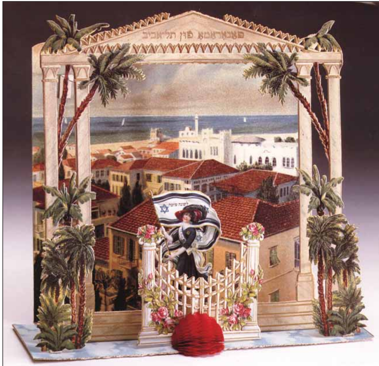
Újévi üdvözlőlapp a százéves Tel-Avivból