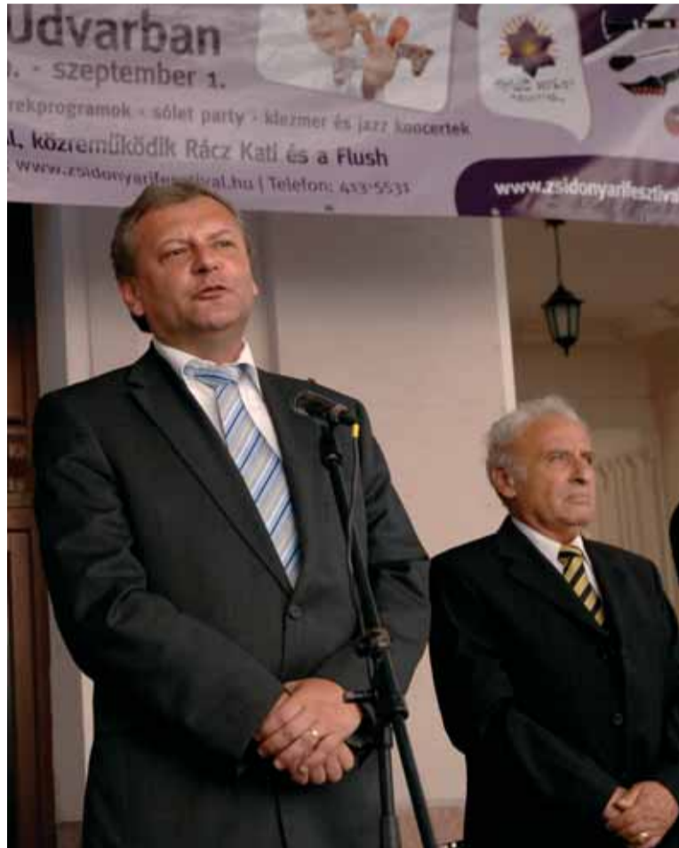
Hiller István kulturális miniszter beszél