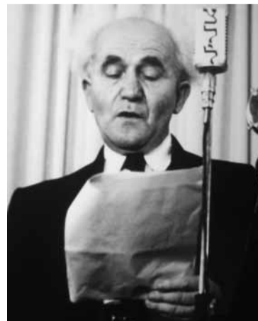
Megszületett a Zsidó Állam – jelenti Ben Gurion